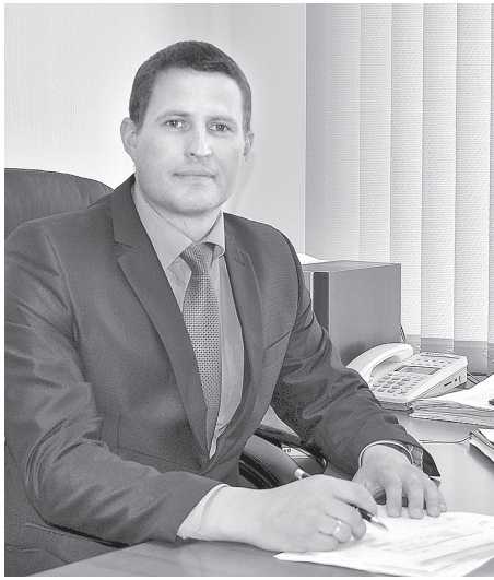
Эдгарс Мексис, заместитель председателя думы