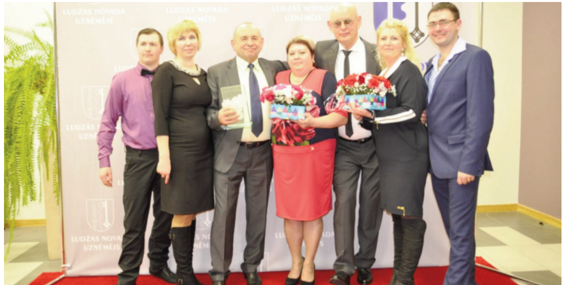
Награду в номинации «Торговец года» получил магазин «CENTRS» ООО «Ludzas maiznīca» (на фото – руководители и работники)

В пятницу, 20 января, в Лудзенском Народном доме предприниматели встретились на мероприятии, во время которого чествовали лауреатов конкурса «Приз предпринимателей Лудзенского края 2016». Состоялся праздничный концерт и танцевальный вечер.