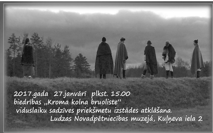
2017.gada 27.janvārī plkst. 15.00 biedrības „Kroma kolna bruoliste” viduslaiku sadzīves priekšmetu izstādes atklāšana. Ludzas Novadpētniecības muzejā, Kuļņeva iela 2

Ekskursiju organizētām grupām ir iespējams pieteikt arī ārpus sinagogas darba laika, pierakstoties vismaz vienu dienu iepriekš Ludzas Novadpētniecības muzejā (J. Kuļņeva ielā 2, Ludzā) vai pa tālruni 65723931.