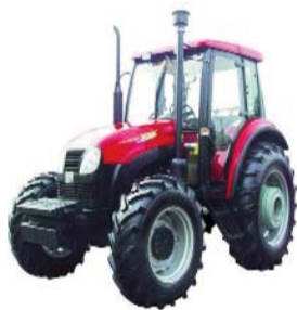
График технического осмотра тракторной техники

Государственное агентство “Государственное агентство по техническому надзору” напоминает о необходимости подготовить тракторную технику и ее прицепы к техническому осмотру.