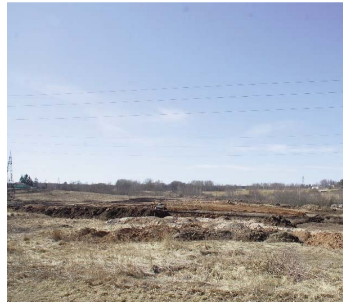
На территории парка сейчас ведутся земельные работы

Сад света создается, как объект природной среды, как источник энергии, напоминающий нам, что надо учиться жить в гармонии с природой. Уже чувствуется приближение весны, и 16 апреля в Зилупе будет праздноваться День весеннего равноденствия.