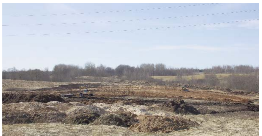
Pašreiz pilnā sparā rit zemes darbi teritorijā, kur būs Gaismas dārzs