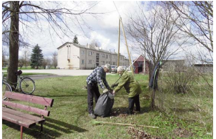
Апрель – месяц чистоты!

Источник финансирования: средства налога на природные ресурсы. Средства из