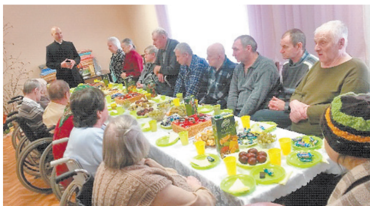
Lieldienu sarīkojumā tika pasniegtas dāvanas katram centra klientam