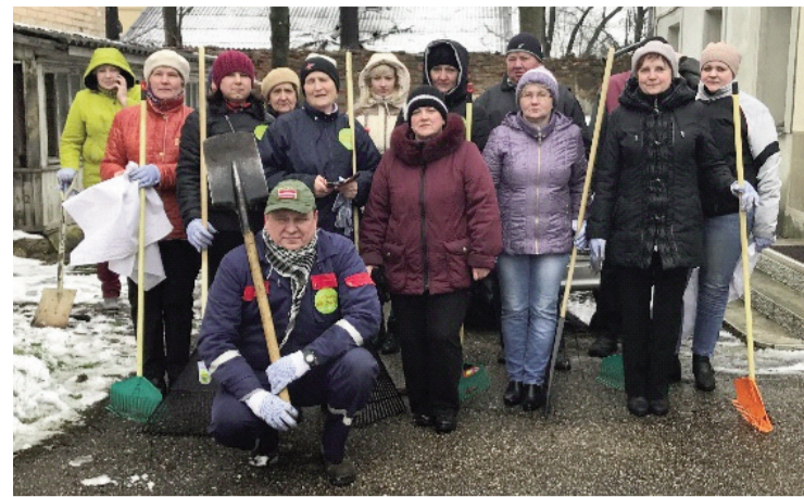
SIA “Ludzas medicīnas centrs” darbinieki talkas laikā sakopa teritoriju pie bijušās slimnīcas Infekcijas nodaļas