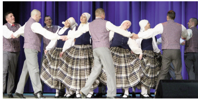
Dejo „Reizē” – I pakāpes diploms.

Ludzas TN notika Latvijas Nacionālā kultūras centra organizētā deju kolektīvu repertuāra pārbaudes skate 2018. gada Deju svētku lieluzvedumam „Māras zeme”.