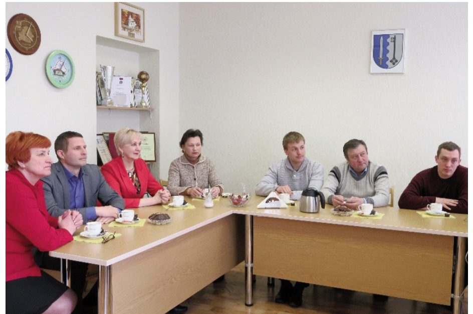
Ludzas novada pašvaldības deputātu kandidātu sarakstu iesniedzēji

Deputātu kandidātu saraksti pēc Centrālās vēlēšanu komisijas datiem: