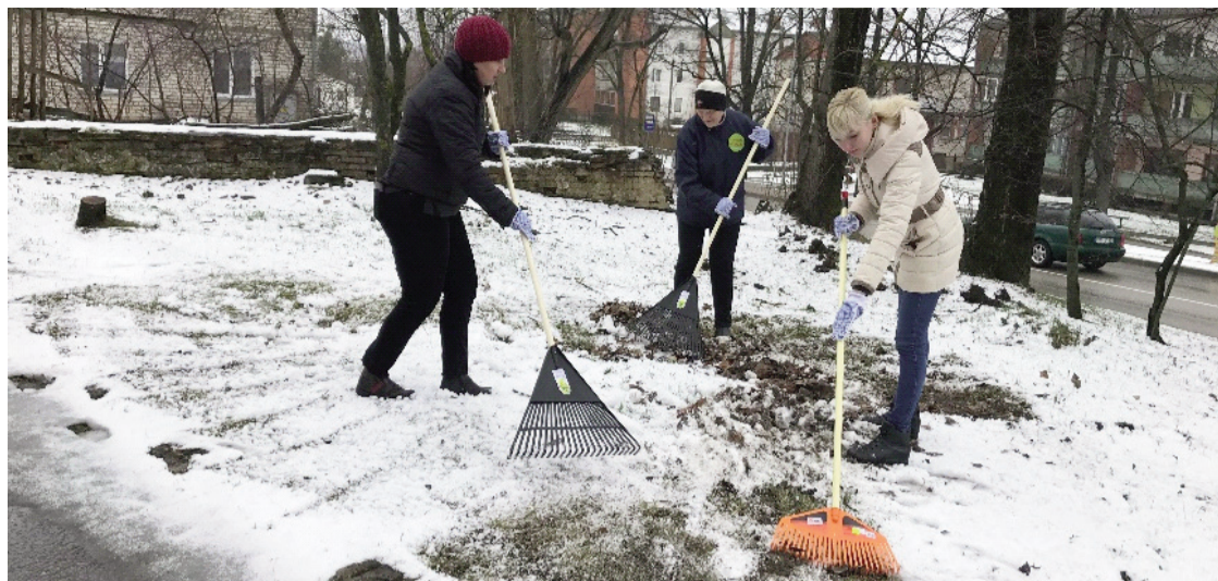
Толока ООО "Ludzas medicīnas centrs" прошла у здания бывшего Инфекционного отделения больницы

Несмотря на неблагоприятные погодные условия в этом году, Большая толока в Лудзенском крае состоялась. Было зарегистрировано 23 места, где проходила уборка территории. Только одна толока была перенесена на другой день – Центр детей и юношества Лудзенского края планирует убрать часть территории в Гарбаровском лесу в другой раз.