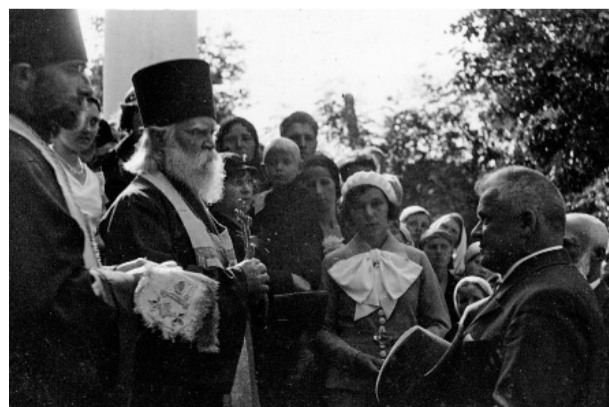
Latvijas Valsts ministru prezidenta un ārlietu ministra Kārļa Ulmaņa un Latvijas valdības locekļu brauciens pa Latgali. Kārlis Ulmanis sasveicinās ar Ludzas pareizticīgo baznīcas garīdzniekiem. Ludza, 1934. gada augusts.

1934. gadā notika K. Ulmaņa brauciens pa visu Latviju. Jūnijā viņš apmeklēja Vidzemi, jūlijā un novembrī – Zemgali,