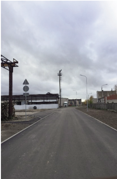
Latgales šķērsiela pēc pārbūves

Ludzā ir pabeigts vēl viens pārbūves objekts – Latgales šķērsiela, kuru pārsvarā izmanto uzņēmēji. Pārbūvi līdzfinansē ES Eiropas Reģionālās attīstības fonds (85%) un valsts (4.5%) – šim mērķim Ludzas novada pašvaldība bija izstrādājusi projekta pieteikumu „Infrastrukturā attīstība uzņēmējdarbības veicināšanai Ludzas, Kārsavas un Ciblas novados“, kura ietvaros Ludzā tiek veikti arī