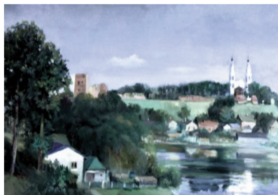
A. Denisenko glezna „Ludza” ir publicēta Vispasaules mākslas darbu katalogā „Art Ģeogrāfija 2017” (tajā publicēti mākslinieku darbi no vairāk nekā 50 pasaules valstīm).

gleznās iemūžinātās skaistās Latgales ainavas. Spilgtākais akcents izstādē – gleznas ar ezera ainavām. Ezeri tāpat kā viduslaiku pils drupas gleznainajā pakalnā ir Ludzas pilsētas vizītkarte.