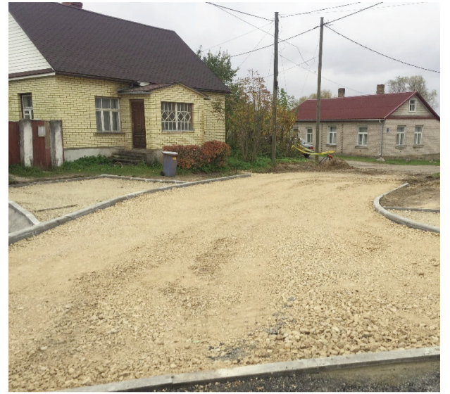
Odu iela tiek noklāta ar pirmo asfalta kārtu. Darbi turpināsies nākamgad

Projekts „Infrastrukturā attīstība uzņēmējdarbības veicināšanai Ludzas, Kārsavas un Ciblas novados“ (Nr. 5.6.2.0/16/I/006) tiek īstenots Darbības programmas „Izaugsme un nodarbinātība” 5.6.2. specifiskā atbalsta mērķa „Teritoriju revitalizācija, reģenerējot degradētās teritorijas atbilstoši pašvaldību integrētajām attīstības programmām” ietvaros. Kopējie projekta attiecināmie izdevumi sastāda 3 205 291.99 euro , no tiem Eiropas Reģionālās attīstības fonda ieguldījums ir 2 616 528.19 euro un valsts budžeta dotācija sastāda 128 042.64 euro. Projekta mērķis ir nodrošināt vides ilgtspēju veicinošu teritoriālo izaugsmi un jaunu darba vietu radīšanu sadarbībā ar uzņēmējiem Ludzas, Kārsavas un Ciblas novadā, reģenerējot degradētās teritorijas un sakārtojot uzņēmējdarbības attīstībai nepieciešamo infrastruktūru novados atbilstoši Ludzas, Kārsavas un Ciblas novada pašvaldību attīstības pro-