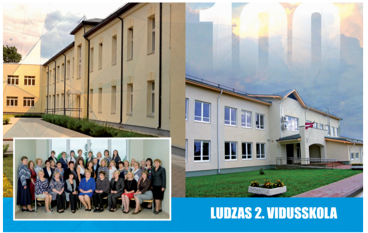
LUDZAS 2. VIDUSSKOLA

Šis ir Ludzas 2. vidusskolas jubilejas gads. Skola atskatās uz 100 gadiem, lai gan tās sākumus varētu meklēt arī 1741. gadā, kad Ludzai bija apriņķa pilsētas statuss un šādās pilsētās bija tautas skolas. Taču Ludzas apriņķi līdz pat 1917. gada beigām nebija vidusskolas.