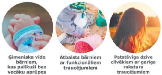
Ģimeniska vide bērniem, kas paliekuši bez vecāku aprūpes