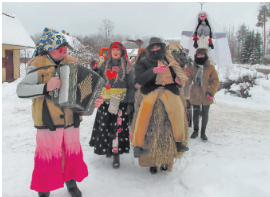
Šogad festivālu rīkoja Latvijas folkloras biedrība sadarbībā ar Kārsavas novada pašvaldību.

Starptautiskie masku tradīciju festivāli Latvijā notiek kopš 1999.gada ik gadu dažādās vietās un vados.