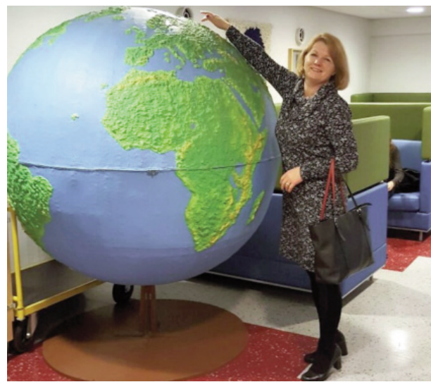
■ В финских школах много различных мест для получения знаний и отдыха, например, это мест с огромным глобусом, чтобы в школе чувствовать себя также хорошо как дома.

Неоднократно слышала утверждение о самых престижных профессиональных сферах в Финляндии: