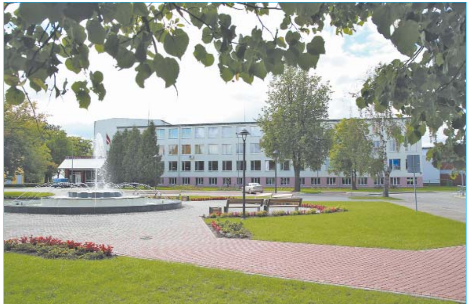
■ Līvānu 1. vidusskola.

Līvānu 1. vidusskola gandrīz pusgadsimtu (no 1944. līdz 1990. gadam) darbojās padomju varas laikā un to vadīja 9 direktori – Pēteris Kāpostiņš (no 1944.-1945. g.), Zigfrīds Trakšs (no 1945.-1947.g.), Anna Sietniece (no 1947.-1949. g.), Roberts Fleitmanis (no 1949.-1953. g.), Jelena Černoduba (no 1953.-1966. g.), Antons Zazerskis (no 1966.-1970. g.), Mečislavs