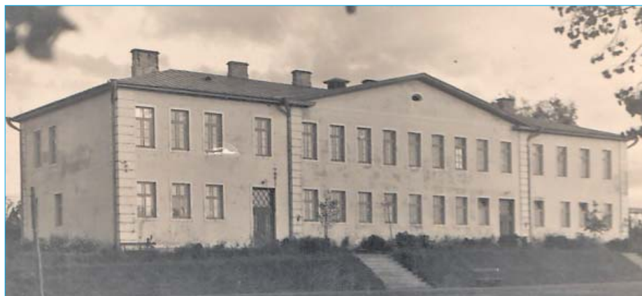
■ Līvānu Valsts pamatskola 20. gs. 30. gados

Rosīga skolā visus laikus ir bijusi mākslinieciskā pašdarbība un sporta nodarbības. Skolā jau vairākus gadus desmitus ar ļoti labiem panākumiem tiek mācīta dambrete, bet no 20.gs. 50. gadiem basketbols ir populārākais sporta veids skolā.