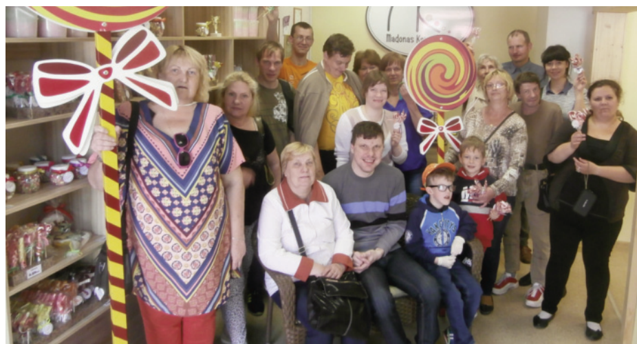
■ Коллектив Дневного центра по уходу в королевстве „Мадонских Карамелей“

Мы накопили новые впечатления, почерпнули новые идеи, и ощутили, что чувство единства коллектива Дневного центра по уходу и в дальнейшем придаст нам силы!