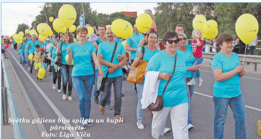
Svētku gājiens bija spilgts un kupli pārstāvēts