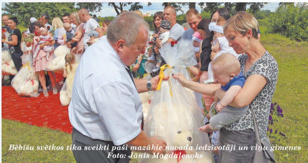
Bēbišu svētkos tika sveikti paši mazākie novada iedzīvotāji un viņu ģimenes