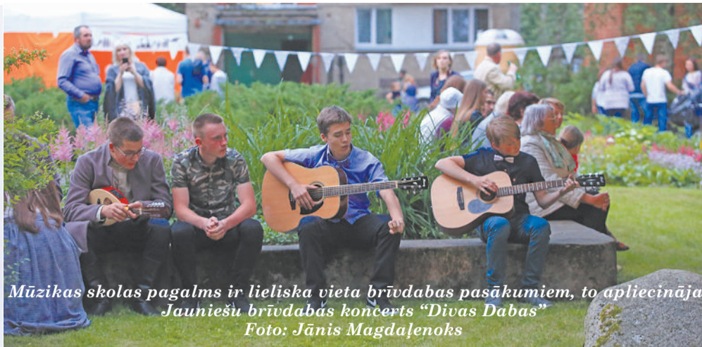
Mūzikas skolas pagalmis ir lieliska vieta brīvdabas pasākumiem, to apliecināja Jauniešu brīvdabas koncerts “Divas Dabas”