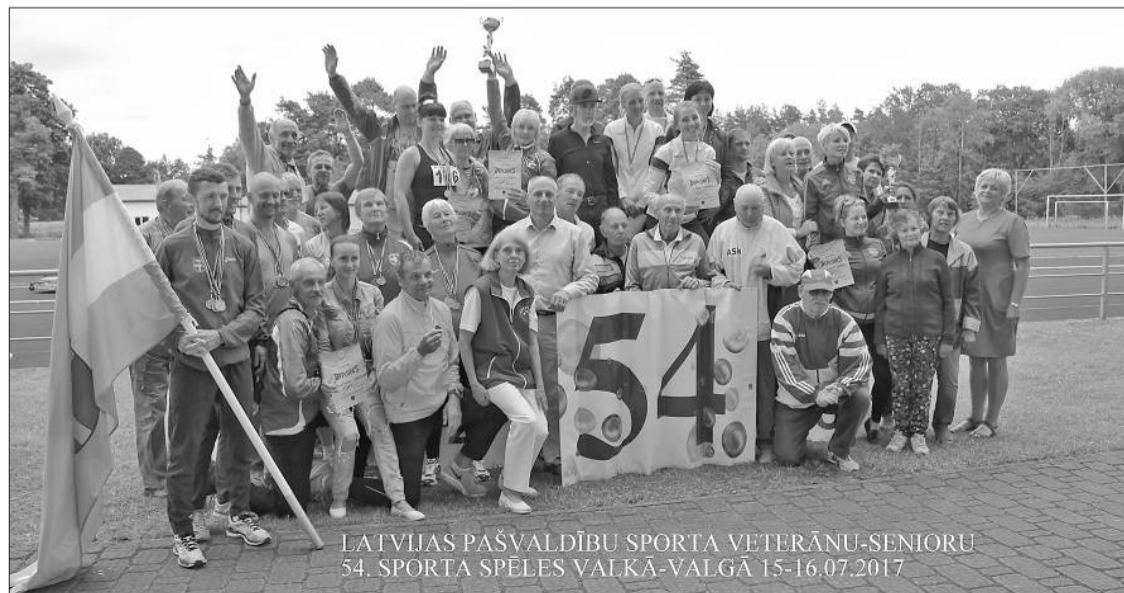
LATVIJAS PAŠVALDĪBU SPORTA VETERĀNU-SENIORU 54. SPORTA SPĒLES VALKĀ-VALGĀ 15-16.07.2017