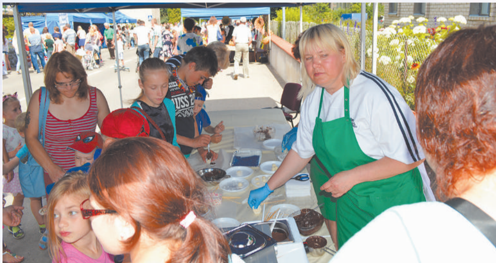
Zaļā iela bija kļuvusi par bērnu un jauniešu ielu ar dažādām atrakcijām un radošajām darbnīcām