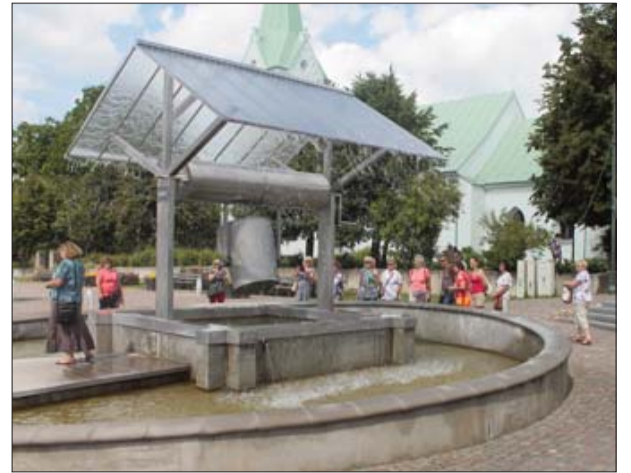
■ Во время летнего путешествия в Добеле у большого фонтана – колодца.

Сотрудничая с депутатами, ожидая идеи от обще-