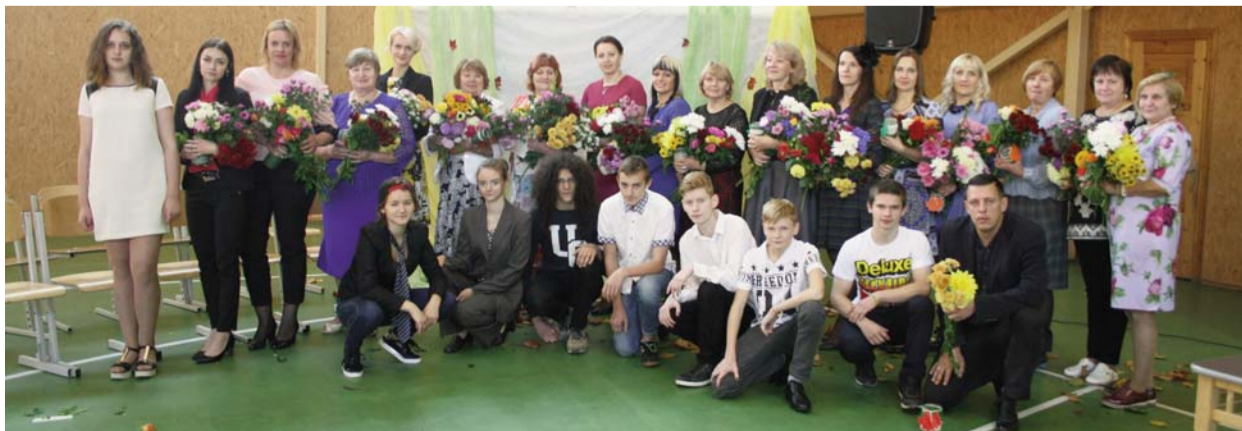
■ Спасибо девятиклассникам за особенный День учителя.

Сильный род, где можно себя подзарядить на встречах родственников, большая семья, где на главном месте внуки и уважение к прабабушкам, поддержка и понимание коллег заставляет чувствовать ответственность за возложенные на меня обязанности.