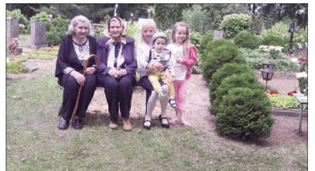
■ Мама с сестрой-близнецом и правнуками.

Еще больше мне нравятся местный патриотизм населения пяти сельских территорий Ливанского края. Пусть исполняются желания жителей Туркской волости и звонкими будут не только женские и мужские голоса фольклорных ансамблей! Пусть растут продолжательницы фольклорных традиций в Яунсилавской основной школе! Пусть Рудзатская волость гордится достижениями школы и старый парк Геленовы, возобновляясь, дает силы труженикам села! Пусть не исчезнет энергия жителей Сутри, разрабатывая и воплощая различные проекты! Пусть людей молодого, среднего и старшего поколения в Рожупе объединяет энтузиазм во всех сферах, как это сейчас происходит в песнях и танцах.