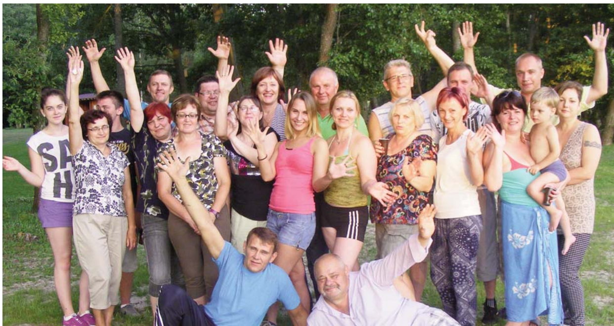
■ Коллектив ООО „Līvānu dzīvokļu un komunālā saimniecība” у озера Сивер

Всем жителям нашего края желаю успешных повседневных будней, мирного дома и благословенным наполненным сердца! Спасибо всем за поддержку и доверие на выборах.