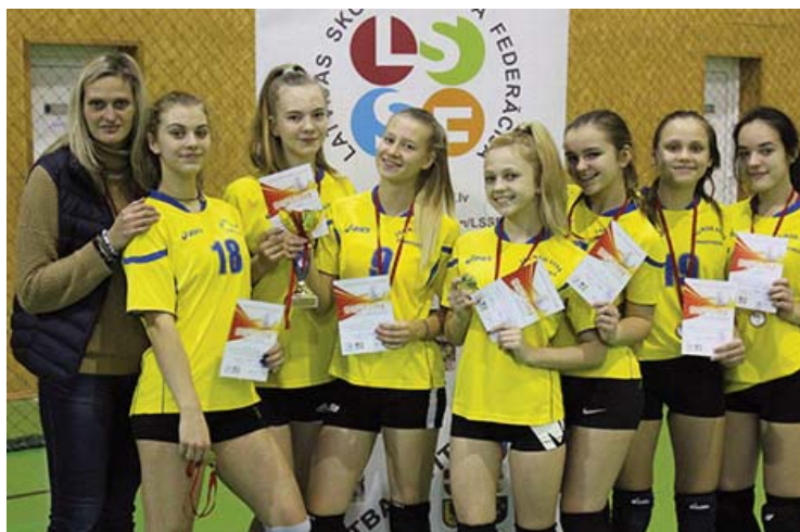
■ Спортивной федерации латвийских школ

удовлетворенность за то, что школьную полочку спортивных призов в течение одного месяца пополнили тремя кубками на вес золота. В школе нас встретили как героев. Бабочки в животе летают до сих пор!