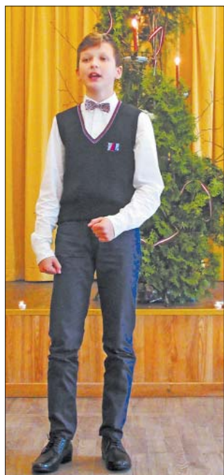
■ Король рассказчиков – и искусства ЛУ, издательство „Liels un mazs”, крестьянское хозяйство „Pīlādži” и др.

Призы для участников финала предоставили: Государственный фонд культурного капитала, ООО „AML” – выставочный комплекс „Rāmava”, Национальный ботанический сад в Саласпилсе, Институт литературы, фольклора и искусства ЛУ, издательство „Liels un mazs”, крестьянское хозяйство „Pīlādži” и др.