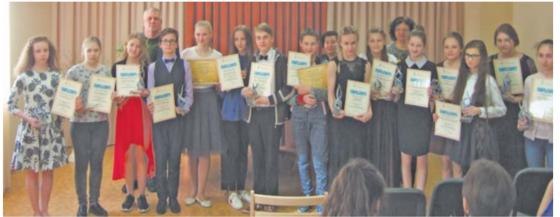
■ XII Jēkaba Graubiņa Jauno pianistu konkursa laureāti un žūrija

Lielu pateicību un apsveikumus pelnījuši arī visu konkursantu vecāki. Mūsu brīnišķīgajā, bet dažreiz ne tik vieglajā darbā ģimenes atbalsts bērniem ir ļoti svarīgs! Paldies visiem! Lai skan mūzika!