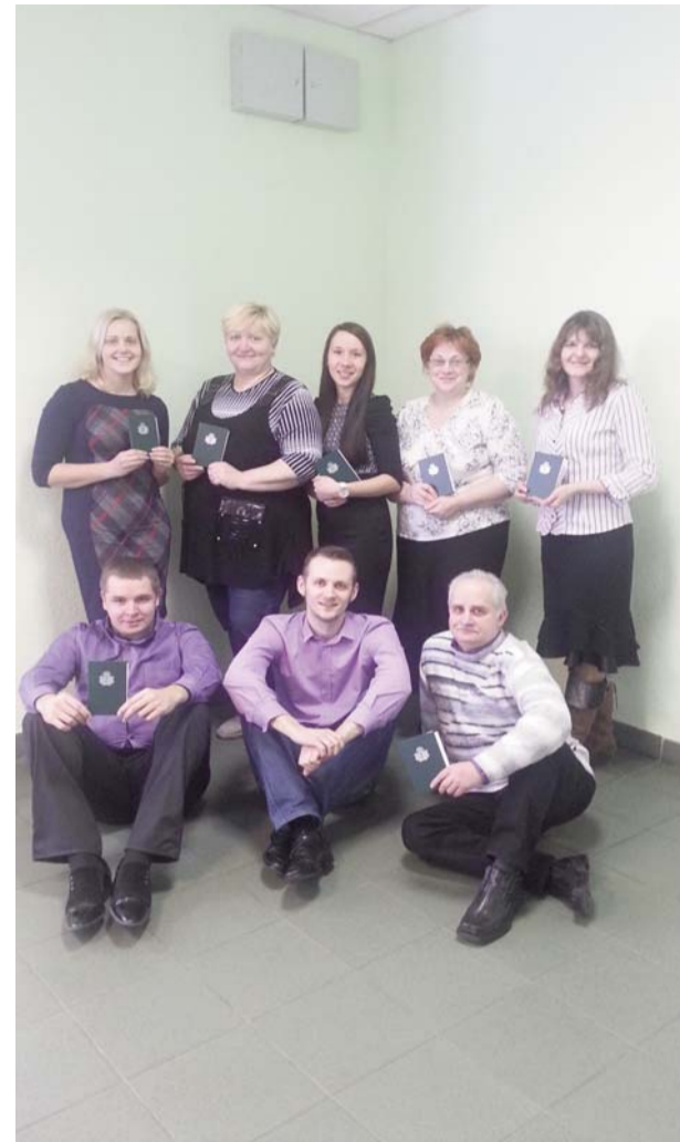
■ Mana pirmā studentu grupa MC Buts Projektu vadības kursā