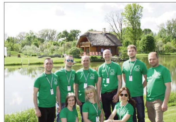
■ Kopā ar fantastiskiem cilvēkiem no biedrības „Līvāni Novada Uzņēmēji”

Tāpat ir jāsaprot, ka šodienas ekonomiskajai izaugsmei, pēc kuras tiecamies, rīt ir jāpāraug garīgā labklājībā. Ja tas nenotiek, tad tas, ko šodien darām, nākotnē zaudēs jēgu. Tu smagi strādā visu mūžu, un beigās tu iedzīvoies atkarībās, slimībās, lielā stresā, un visa tava dzīve kļūst par vienu lielu maldinājumu – piepildījuma nav. Es arī nepiekrītu tiem, kuri uzskata, ka šeit nekā nenotiek. Piemēram, pavērojiet internetu, kas ir tie ļautiņi, kuri komentāros apmētā ar dubļiem mūsu novadu? Lielākais vairākums no viņiem nestrādā un nedzīvo Līvānu novadā. Savukārt tie, kuri dzīvo šeit un saka, ka viss ir slikti un perspektīvas nav, patiesībā ļoti maz zina un maz interesējas par to, kas vispār novadā notiek. Lai attīstība noritētu raitāk, mums visiem ir jāmaina domāšana no „kad tas vienreiz beigsies” uz „man ir ideja un es zinu kā”. Cilvēki nezin kāpēc ir iedomājušies, ka liekot negatīvas ziņas par novadu sociālajos tīklos, tās „laikojoļ” vai daloties ar tām, veic nozīmīgu ieguldījumu problēmu risināšanā. Man gan liekas, ka spēks ir tajā, ka dzīvojam rūpēs par savu vidi, jo mūsu lielākais klupšanas akmens šobrīd ir vienaldzība pret apkārt notiekošo.