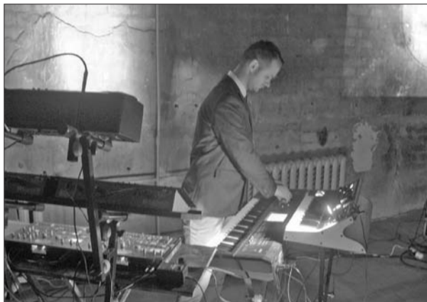
■ Koncertieraksta filmēšana Mūsdienu Mākslas galerijā

Visa mana dzīve ir vaļasprieks ļoti vienkārša iemesla dēļ – es daru to, kas man patīk, un to, kur es spēju izmantot sevi ar pilnu potenciālu. Es ar to arī pelnu iztiku. Man nav tāda jēdziena kā darba laiks, darba nedēļa, brīvdienas, atvaļinājums un hobiji. Es tā nedzīvoju – tas viss ir viens liels plūdums. Imants Ziedonis ļoti pareizi ir to atspoguļojis savā dzejā: „...ir tikai jājūt lietu ritms un jāatrod sevi pašu šais ritmos”.