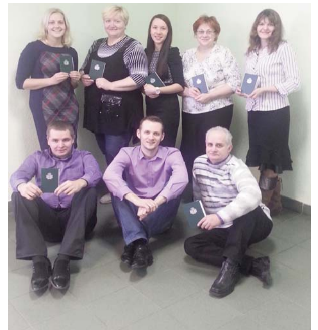
■ Моя первая группа студентов в УЦ „Buts“ на курсе по управлению проектами

Для того, чтобы развитие проходило быстрее, мы все должны изменить мышление с „когда это все кончится“ до „у меня есть идея, и я знаю, как“. Люди почему-то возмнили, что распространяя в социальных сетях негативную информацию о крае, ставя „лайки“ или делая ее, вносят важный вклад в решение проблем. А вот мне кажется, что сила в том, что мы живем, заботясь о нашей окружающей среде, ведь нашим самым большим камнем преткновения в настоящий момент является безразличие ко всему происходящему вокруг.