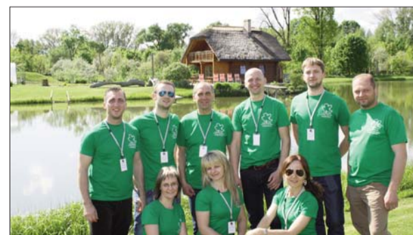
■ Вместе с фантастическими людьми из общества „Livāni Novada Uzņēmēji“

Следует также понимать, что нынешний экономический рост, к которому мы стремимся, завтра должен перерасти в духовное благополучие. Если этого не произойдет, то все, что мы делаем сегодня, потеряет смысл в будущем. Ты всю жизнь тяжело работаешь и в конце наживаешь себе зависимости, болезни, большой стресс и вся твоя жизнь становится одним большим заблуждением – достижений нет. Также я не согласен с теми, которые считают, что здесь ничего не происходит. Например, наблюдайте в интернете, кто они - эти люди, которые обливают грязью наш край? Большинство из них не проживают, и не работают в Ливанском крае. В свою очередь те, которые здесь живут и говорят, что все плохо и перспективы нет, в действительности мало что знают и мало интересуются тем, что вообще в крае происходит.