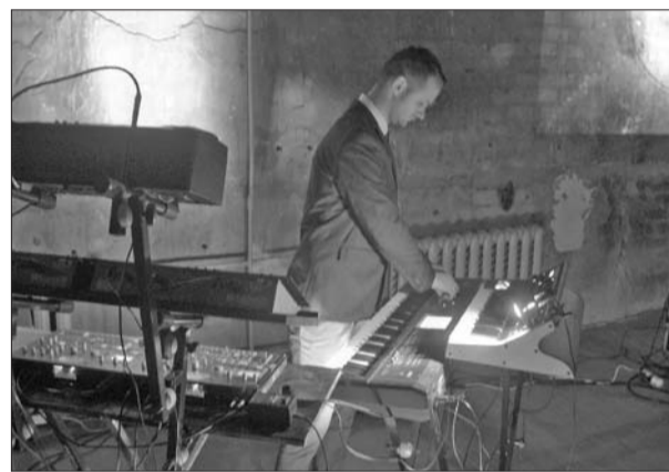
■ Съемка концертной записи в Галерее современного искусства

Я сам всегда стараюсь сохранить открытость своей жизни, потому что люди все равно будут думать то, что они хотят думать обо мне, но на мой жизненный опыт это не влияет. Девиз по жизни у меня тоже когда-то был, который я часто менял, но в тот момент, когда я понял, что все эти девизы просто позаимствованы из слов других людей или происходят из определенной культуры, я отказался от идеи девиза вообще. Я не смотрю на события этой жизни как на цели жизни, которые нужно достигнуть. Скорее, я вижу эту жизнь как шаг к чему-то более высокому, и я не стараюсь быть успешным – скорее я ищу способы как себя более эффективно использовать, ведь жизнь протекает не С НАМИ – жизнь протекает ДЛЯ НАС!