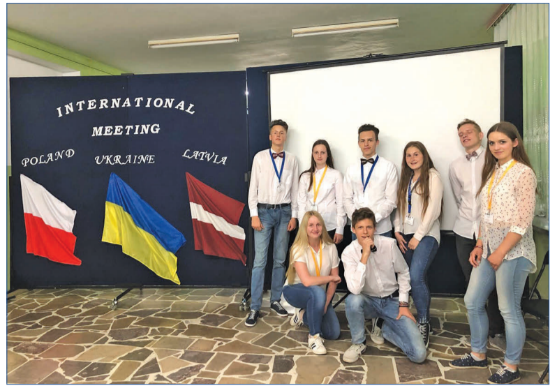
Auces vidusskolas skolēnu grupa Jozefovā pie Vislas.