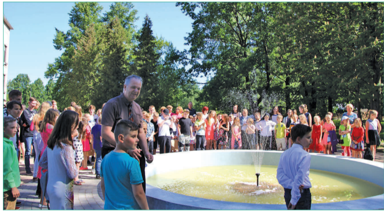
Renovētā strūklaka pie Bēnes vidusskolas.

Koki iztur lietu, sniegu, vēju un salu. Tie bezrūpīgi grieztojas ar lietuslāšu kuloniem, lāsteku piekariem un sniega diadēmām. Koki stāv un gaida, un to augsmes spēks šķiet aplūsis. Taču iekšienē neredzami briest jauna sākotne. Koku izturība patiesi atbilst to iekšējai būtībai. Ar šo stiprumu koki panes gan dzīves likstas, gan krāšņumu, jo nedz sliktais, nedz labais nespēj mainīt to būtību. Arī mums pacietīgi jānes gan liela veiksmē, gan liela neveiksmē. Lai kas arī notiktu, mums jāpaliek uzticīgiem savai iekšējai būtībai.