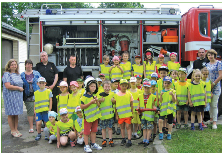
PII „Pīlādzītis” ciemojās VUGD Auces postenī.

Bērni iepazīs ar ugunsdzēsēju glābēju ikdienu, izstāģēja ugunsdzēsēju depo, apskatīja VUGD tehniku, izmēģi-