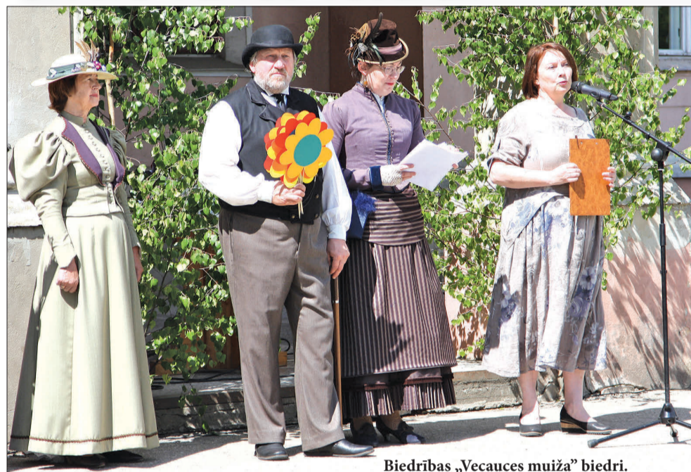
Biedrības „Vecauces muiža” biedri.

20. maijā Vecauces pils pagalmā ar radošām aktivitātēm tika aizvadīti Vasarsvētki. Tā kā pasākumā varēja gan iegādāties mājražotāju un amatnieku darinājumus, gan arī noklausīties Auces novada biedrību un organizāciju prezentācijas, iesaistīties dažādās radošajās aktivitātēs un baudīt koncertu, sev interesējošas nodarbes noteikti varēja atrast ikvienas paaudzes cilvēks.