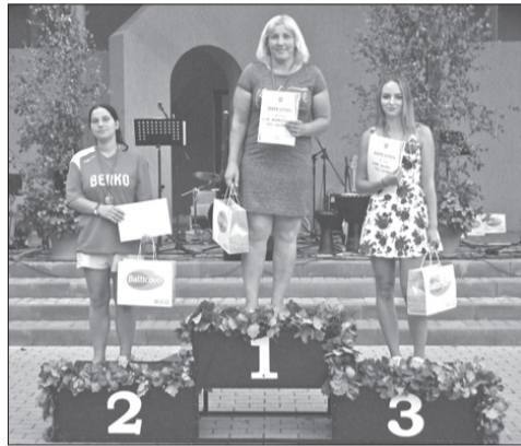
↑ Uzvarētājas šautriņu mešanā ← un roku laušanās sacensībās.