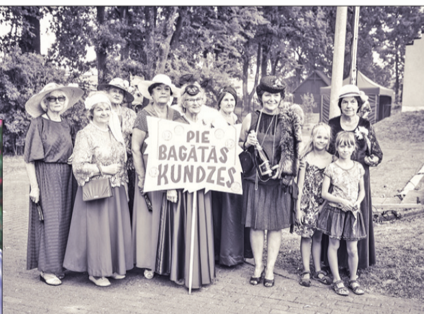
↑ Deju kopa „Randiņš” svētku gājienā izcēlās ar savu eleganci un šarmu, iejūtoties filmas „Pie bagātās kundzes” laikos.