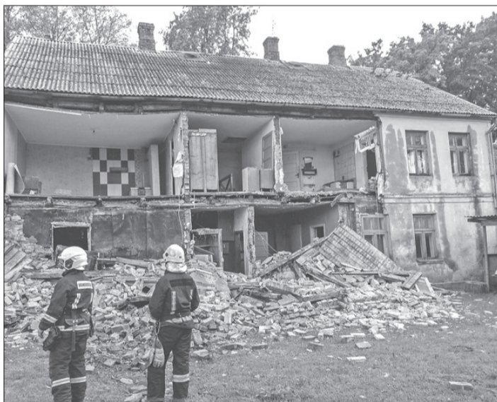
Skats uz ēku Dzirnau ielā 5 Aucē.