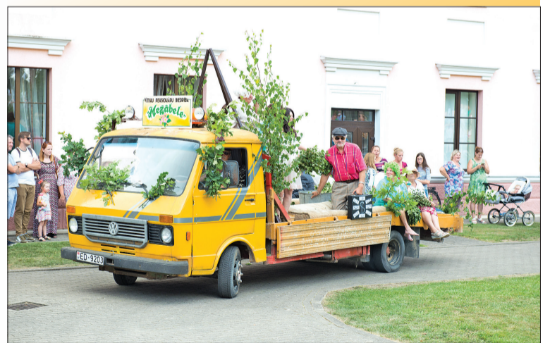
↑ Šogad Vitiņu pagasta pensionāru biedrība „Mežābele” svētku gājienā pārsteidza ne vienu vien skatītāju.