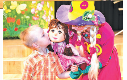
↑ Arī jaundzimušo brāļiņiem un māsiņām bija interesanti, jo Čučumuižas rūķi taču ir tik jauki!