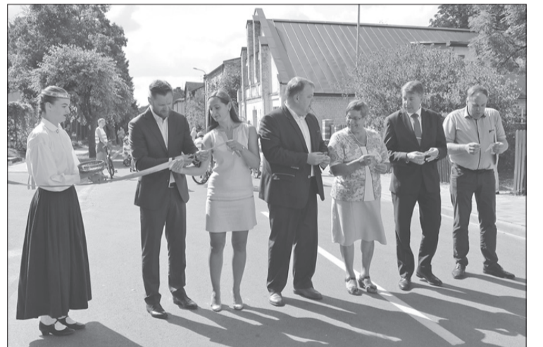
Miera ielas atklāšanā svinīga sarkanās lentas pārgriešana.

Informāciju sagatavoja Gita Šēfere-Steinberga Sabiedrisko attiecību speciāliste