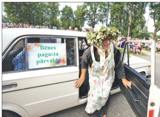
↑ Bēnes pagasta pārvalde gājienā ieradās ar „limuzīnu Jājunakts krāsā”.