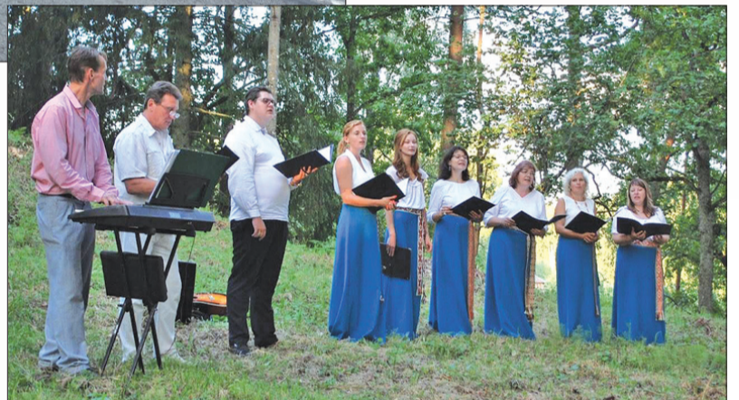
↑ Īles vokālais ansamblis „Spārni” svētku priekšvakarā priecēja ar īpašu noskaņu Spārnu pilskalnā.