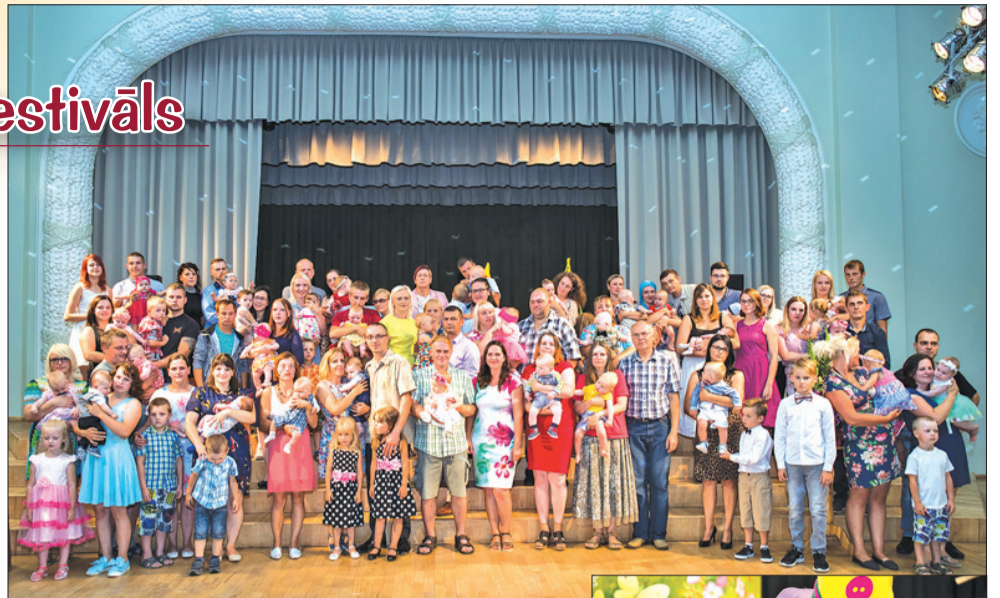
↑ Auces novada svētki šogad iesākās ar jaundzimušo godināšanas pasākumu „Izšūpos dzimtā mala man mazu valodzīti”.