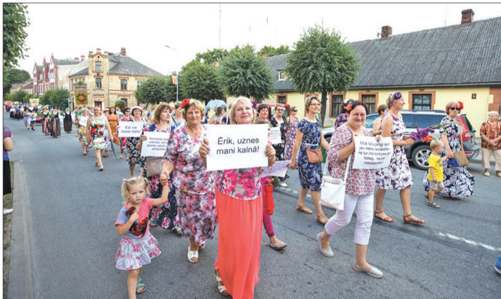
↑ Pirmo reizi šogad svētku gājienā piedalījās arī Auces vidusskolas skolotāju un darbinieku kolektīvs.