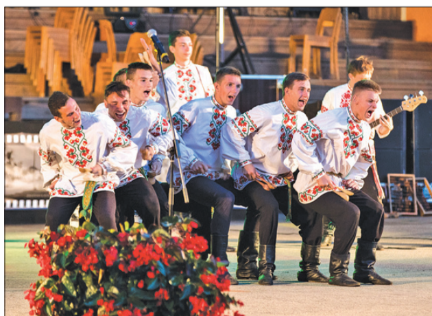
↑ „Nesvižas ložkari” aucenieku un viesu sirdis jau paspēja iekarot pērnā gada septembrī, kad Aucē notika „Baltkrievijas dienas Latvijā”.