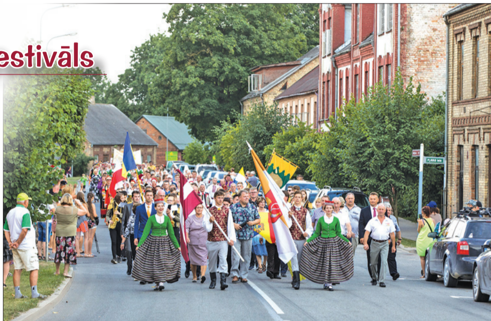
↑ Kā allaž, svētku gājiena priekšgalā Auces novada domes vadība un ārvalstu sadarbības pašvaldību pārstāvji.