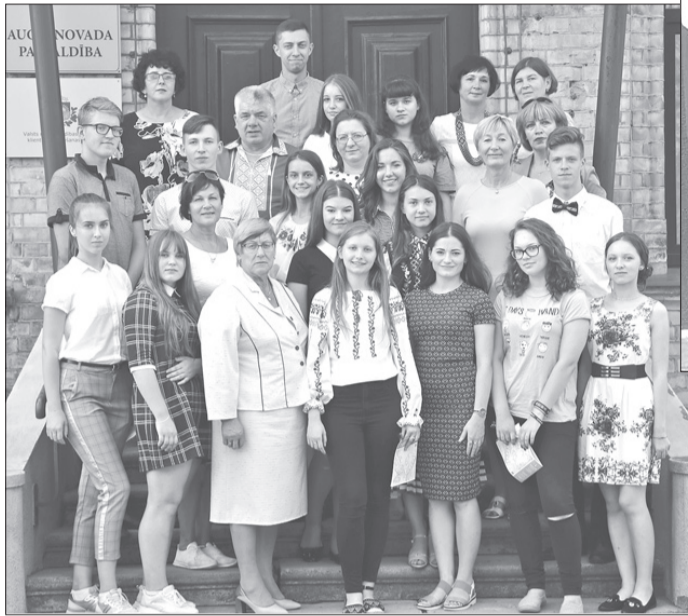
Kopbilde, kas tapusi, viesojoties pie domes priekšsēdētājas.

Projekts „Auce 2018” ir izskanējis, ir palikušas tikai skaistas atmiņas, prieks, jauniešu smieklis un apmierinājums un ganda-