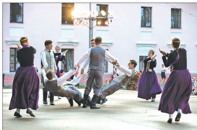
↑ JDK „Virpulis”, kā allaž, vieglā soli virpuļoja par prieku skatītājiem.