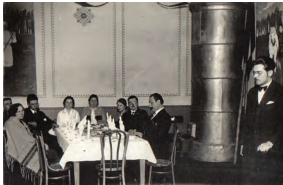
Balts galdauts svētku reizē vecajā pagasta namā 20.gs. 20./30. gados.

Baltā galdauta svētkus kuplinās Ādažu Kultūras centra amatiermākslas kolektīvi. Divi dziedošie autobusi ar svētku dalībniekiem apmeklēs 7 vietas novadā: Kadagu, Podniekus, Garkalni, Alderus, Baltezeru, Stapriņus un uzstāsies novada centrā – Ādažos. Lai visi kopā sadziedātos un sadancotos! Svētku norisi aicinām veidot jums pašiem, jo katram ciemam, katrai mūsu novada vietai savas “īpašās” tradīcijas