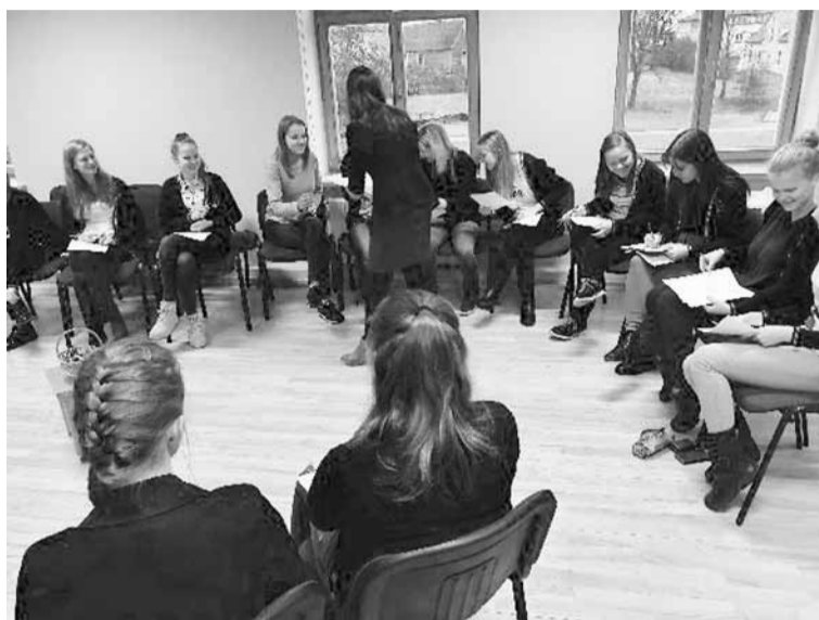
Karjeras izglītības pasākums skolēniem.

Karjeras izglītības saturs ir integrēts izglītības programmas saturā, tostarp mācību priekšmetu saturā. Skolotāji, mācot attiecīgo priekšmetu, cenšas saistīt to ar reālo dzīvi. Stundās skolēni iemācās praktiskas lietas, kas saistītas ar karjeras izglītību, piemēram uzrakstīt CV, motivācijas vēstuli, iepazīstas ar Darba likumu, apskata darba līgumu paraugus, noskaidro,