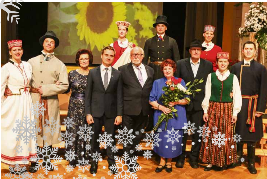
Dziedošo muzicējošo ģimeņu "Spiets" koncertuzveduma noslēgums.