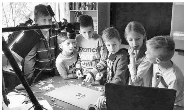
Animācijas filmiņas veidošanas process.

Kādas personības darbojas animācijā? Kā šie cilvēki ir izvēlējušies profesiju saistītu ar kino un šajā gadījumā animāciju? – bet arī bija iespēja pašiem redzēt vizuāli krāšņu lekciju par dažādām profesijām, kas nepieciešamas, lai izveidotu animācijas filmu. Skolēni tika iepazīstināti ar konkrētām personībām no vadošajām studijām Latvijā. Pirms praktiskās darbošanās skolēniem bija iespēja noskatīties fragmentus no animācijas filmiņām „Kā Lupatiņi uzminēja”, „Kā Lupatiņi šūpojās” un „Kā Lupatiņi precējās.” Tad nodarbības otrajā daļā dalībnieki grupiņās varēja iejusties režisora un reanimatora lomā, praktiski darbojoties ar animācijas filmu tehni-