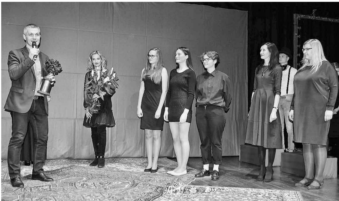
Stafeti – ceļojošo balvu "Pūznis" – Liepājā saņem Madonas novada pārstāvji.

Dienas otrajā pusē, kamēr pedagogi baudīja ekskursiju pa Liepāju, jaunieši devās uz koncertzāli "Lielais dzintars", kur ar devīzi "Dzīve kā košums", norisinājās "Liepāja – Latvijas Jauniešu galvaspilsēta 2017" noslēguma pasākums, kā arī Liepājas brīvprātīgo jauniešu godināšanas ceremonija. Krāsai-