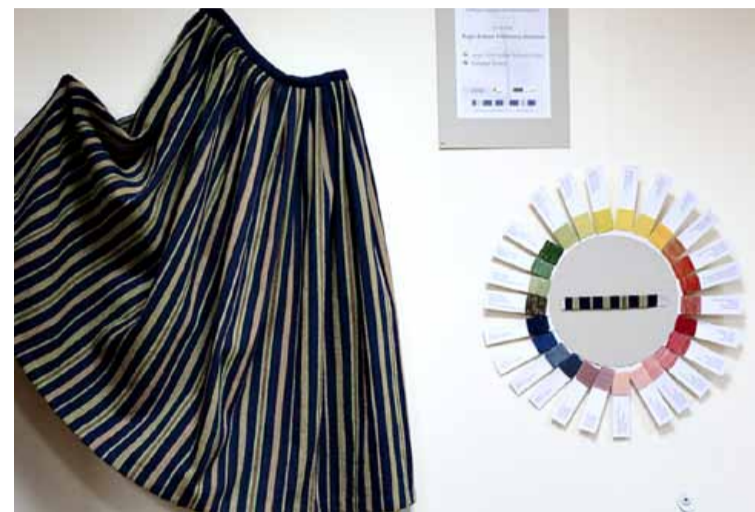
Sarkaņu brunči austi no augu krāsvielās krāsotas vilnas dzijas.

Šī projekta astoņas sestdienas Sarkaņu bibliotēkā Ilzes