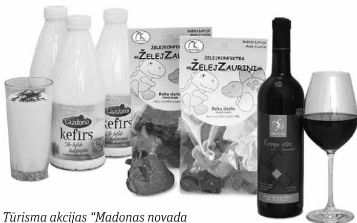
Tūrisma akcijas “Madonas novada garša 2017” titulu ieguvēji ir “Lazdonas piensaimnieks”, “Madonas karameles” un “Domu pietura”.

Visu tūrisma akcijas laiku, ikviens ceļotājs varēja aizpildīt anketu un tajā norādīt ne tikai vietas, ko ir apmeklējis, bet arī akcijas produktiem piešķirt kādu no tituliem. Apkopojot anketu datus, varēja pārliecināties – cik ceļotāju, tik sajūtu, katram savi garšas karaļi un interesantāko stāstu stāstnieki, katram sava gaume par ie-