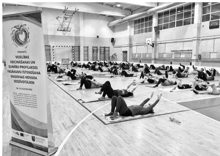
Aktīvie Kalsnavas pagasta vingrotāji.

Jau šī gada nogalē projekta ietvaros var sarīkot fizisko