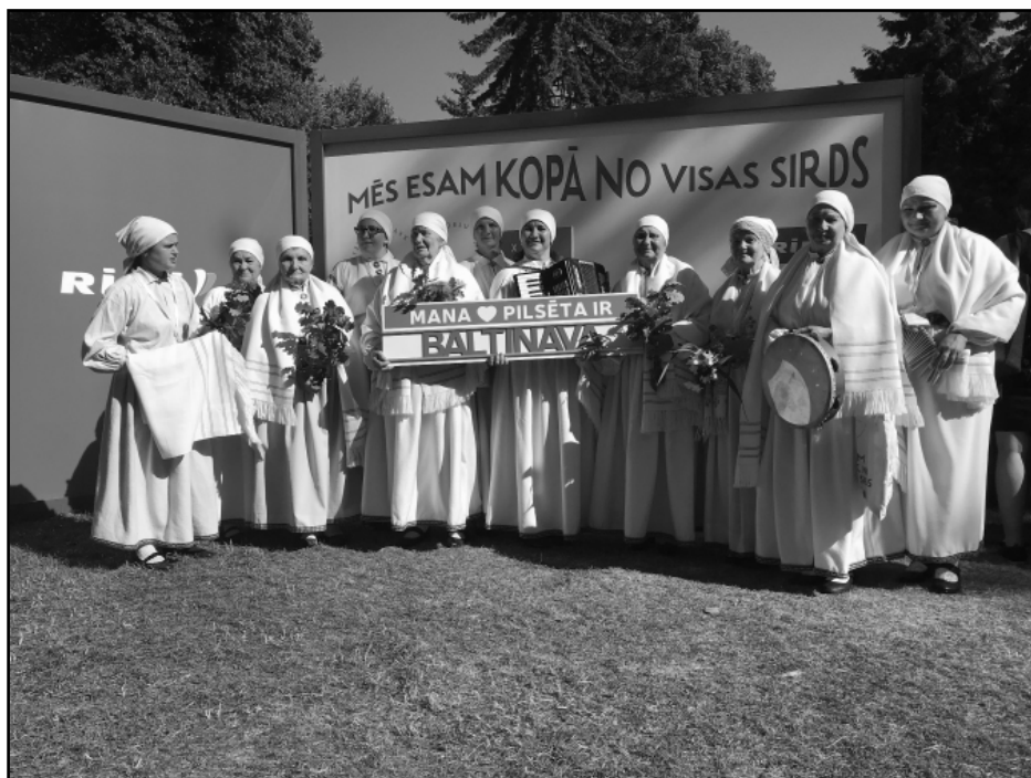
Baltinavas etnogrāfisko ansambli Vērmanes dārzā sagaidīja ar ovācijām

Etnogrāfisko ansambli Vērmanes dārzā sagaida ar ovācijām