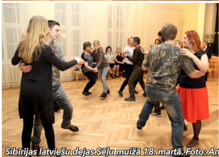
Sibīrijas latviešu dejas Sēļu muižā 18. martā.