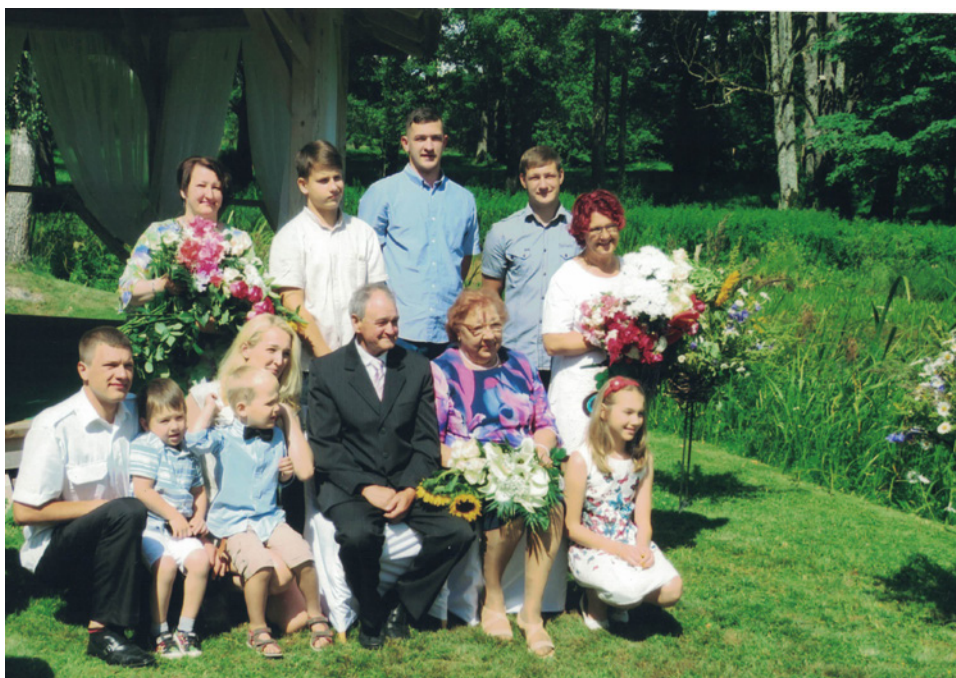
BĒRNI, MAZBĒRNI UN MAZMAZBĒRNI "ZELTA KĀZU" JUBILEJAS PASĀKUMĀ SĒĻOS