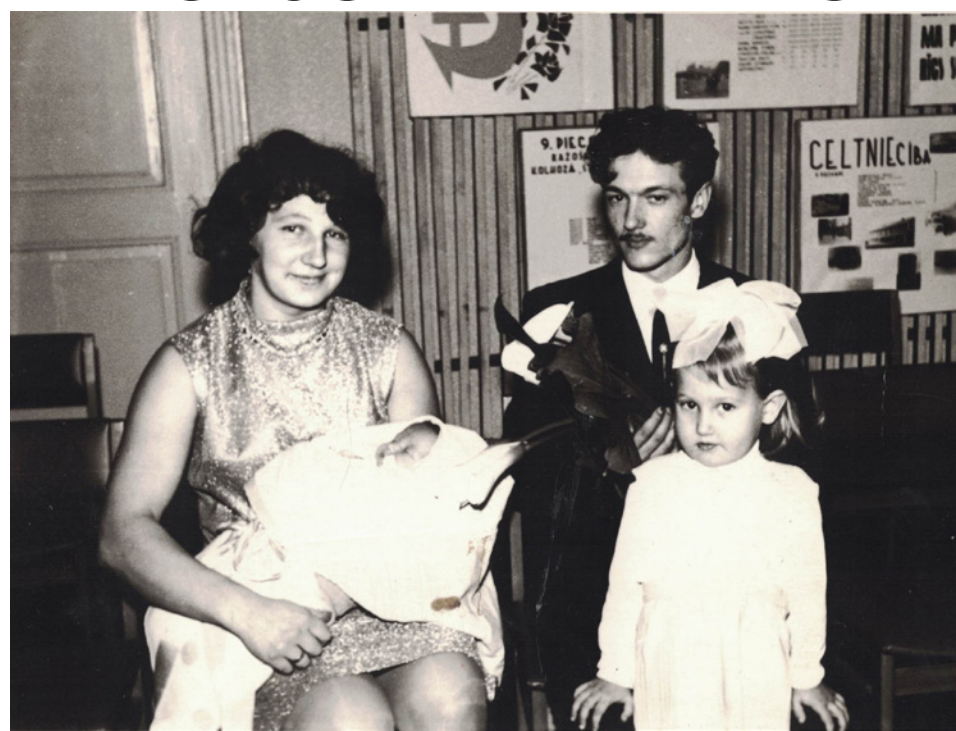
JAUNĪBĀ - MEITAS KRISTĪBAS

Iepriekš bijām svinējuši 40 gadu jubileju. Šogad svinības bija mūsu meitu pārsteigums. Tā kā bērniem vasarā bija atvaļinājums, svinējām