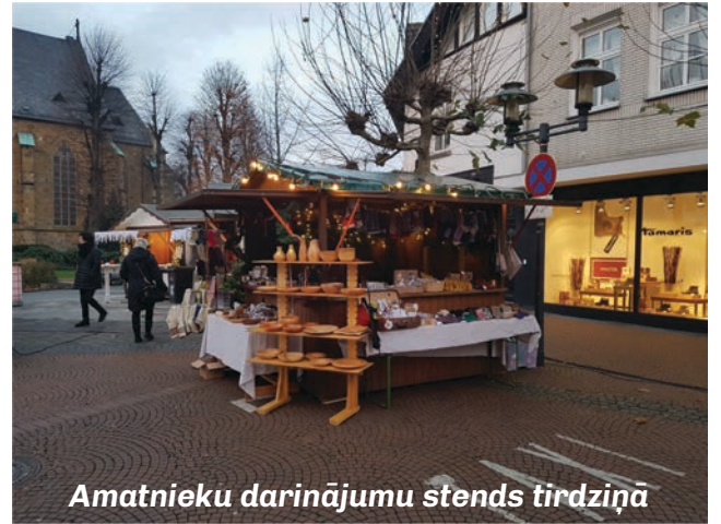
Amatnieku darinājumu stends tirdziņā