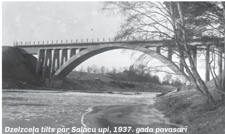
Dzelzceļa tilts pār Salacu upi, 1937. gada pavasarī