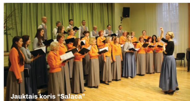
Jauktais koris "Salaca"