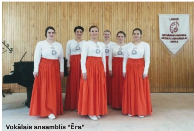
Vokālais ansamblis "Ēra"

Turēsim īkšķus par mūsu kolektīviem, lai viņiem izdodas parādīt savas lieliskās prasmes, lai raits deju solis un skanīgs balsis!