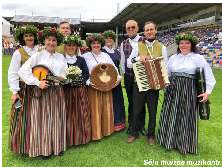
Sēļu muižas muzikanti