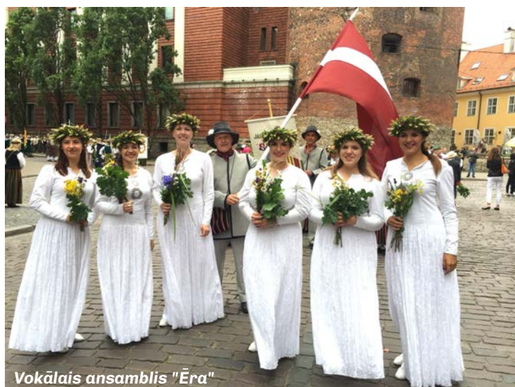
Vokālais ansamblis "Ēra"