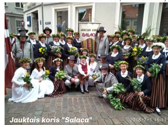
Jauktais koris "Salaca"