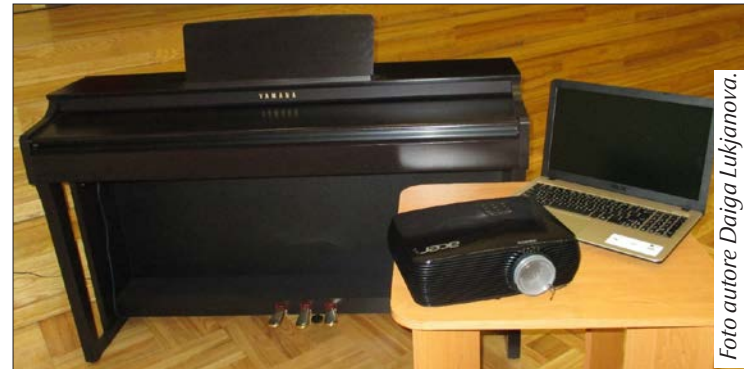
Projekta ietvaros iegādātas digitālās klavīeres, portatīvais dators un projektor.

Atbalsta Zemkopības ministrija un Lauku atbalsta dienests