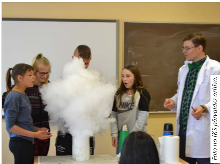
Eksperimentos piedalījās arī skolēni.