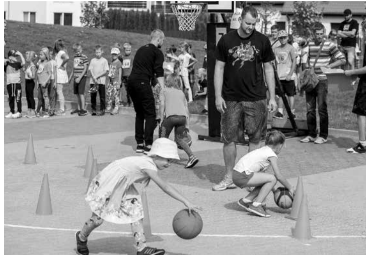
Bērni savus spēkus izmēģināja visdažādākajos sporta veidos.