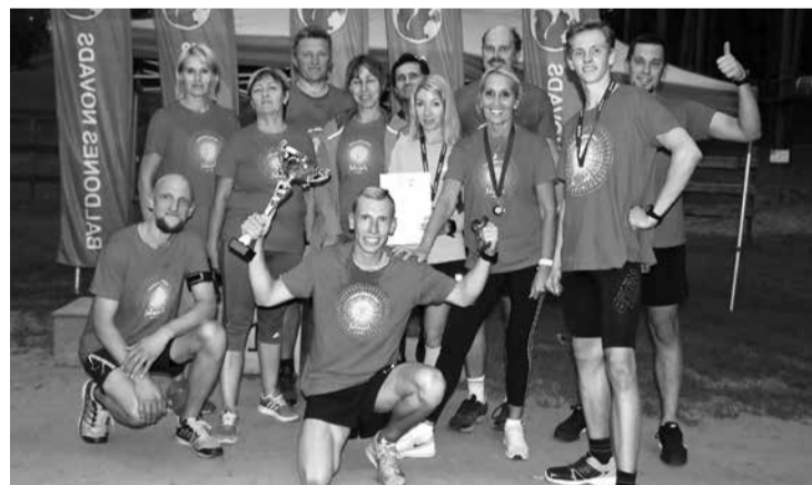
Lepni ne tikai par otro vietu, bet arī par izcīnīto vienādo punktu skaitu ar līderiem no Mārupes.

11. septembrī notika Pierīgas sporta spēļu sacīkstes vieglatlētikas krosā, kurās piedalījās arī Salaspils novada komanda. Tās sastāvā startēja Salaspils sporta skolas pārstāvji un skrējēju seriāla “Veselības otrdiena 2018” dalībnieki. Sacensībām varēja pieteikt 15 cilvēku komandu, un komandas ieskaitē vērtēja sešu labāko dalībnieku izcīnītos punktus katrā vecuma grupā.