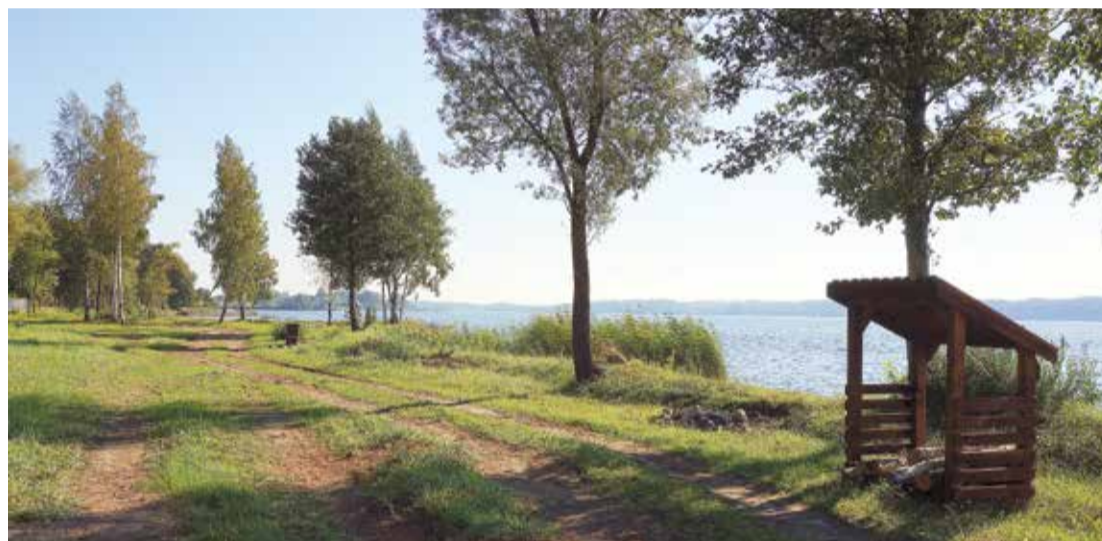
Atpūtnieku ērtībai ir uzstādīti jauni soliņi, atkritumu tvertnes, nojumes malkas novietnei, biotualetes un informatīvie stendi.

04-AL25-A019.2201-000005), kas ir pirmā projekta turpinājums un kura kopējās izmaksas veido 56 576.57 eiro, tai skaitā ELFLA līdzfinansējums – 27 000.00 eiro, pašvaldības līdzekļi – 29 576.57 eiro. Pasākums tika organizēts Eiropas Lauksaimniecības fonda lauku attīstībai Latvijas Lauku attīstības programmas 2014.-2020.gadam 19.2. apakšpasākumā „Darbību īstenošana saskaņā ar sabiedrības virzītas vietējās attīstības stratēģiju” 19.2.2. aktivitātes “Vietas potenciāla attīstības iniciatīvas” ietvaros. Darbu ietvaros ir izveidotas gājēju takas, kā arī atsevišķās vietās tika veikta esošā zāliena stiprināšana ar šķembām vai oļiem, izbūvētas divas jaunas sausās biotualetes, izveidotas piecas jaunas atpūtas vietas ar soliem, ugunsurka vietām, atkritumu urnām un malkas novietnēm, kā arī ir uzstādīti pieci stendi ar informāciju par kārtības