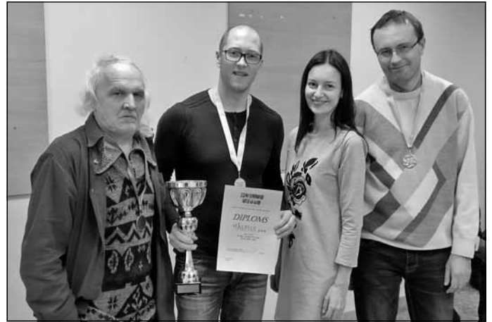
Mālpils novada komanda – Pierīgas novadu sporta spēļu šahā uzvarētāji