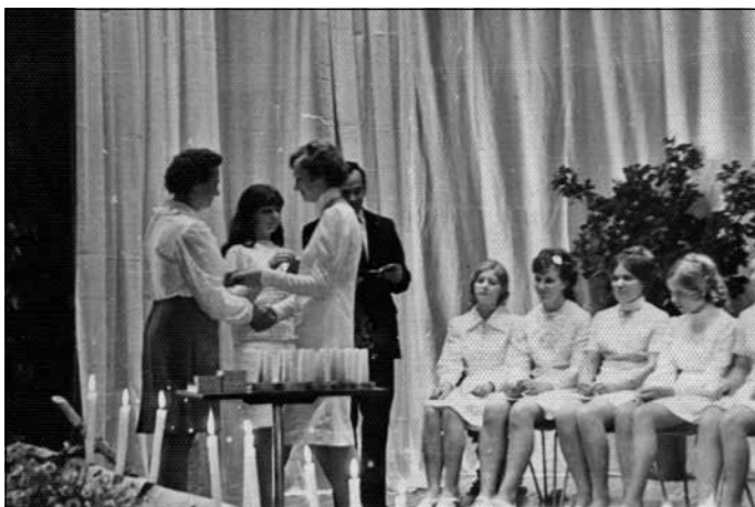
Pilngadības svētki LPSR Lauksaimniecības ministrijas Mālpils sovhoztehnikuma jaunās ēkas zālē, 1970./1971. gads