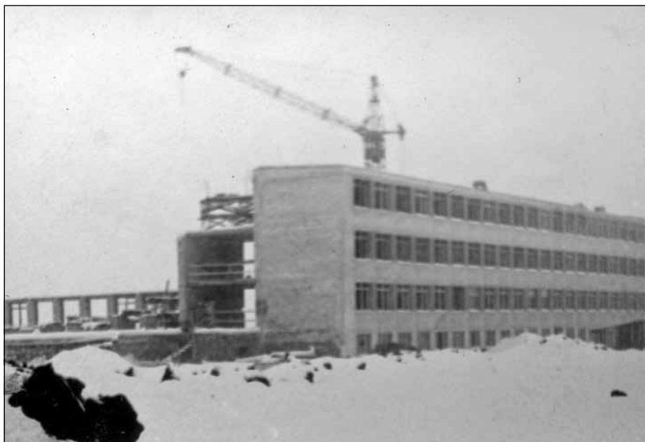
Top jaunā tehnikuma ēka Mālpilī, ap 1965. gadu