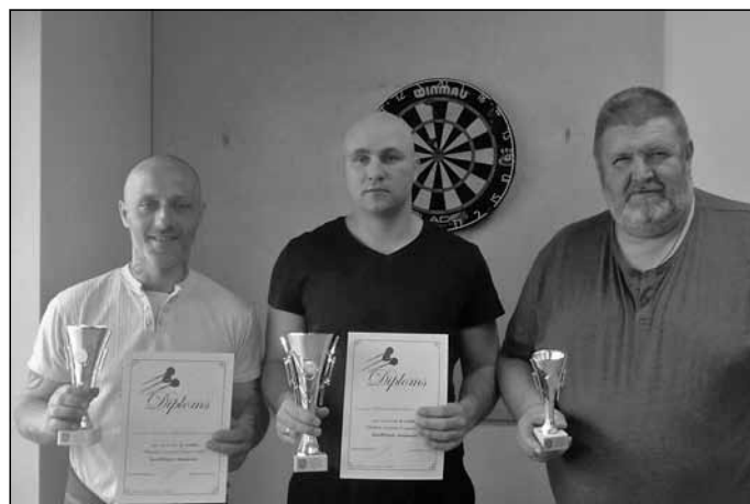
Godalgoto vietu ieguvēji Mālpils novada sacensībās šautriņu mešanā