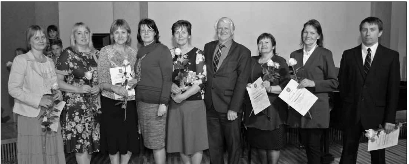
Mālpils novada pašvaldības izglītības iestāžu skolotāji, kuru audzināmie guvuši panākumus starpnovadu, reģionāla, valsts un starptautiska mēroga mācību priekšmetu olimpiādēs, konkursos un sacensībās