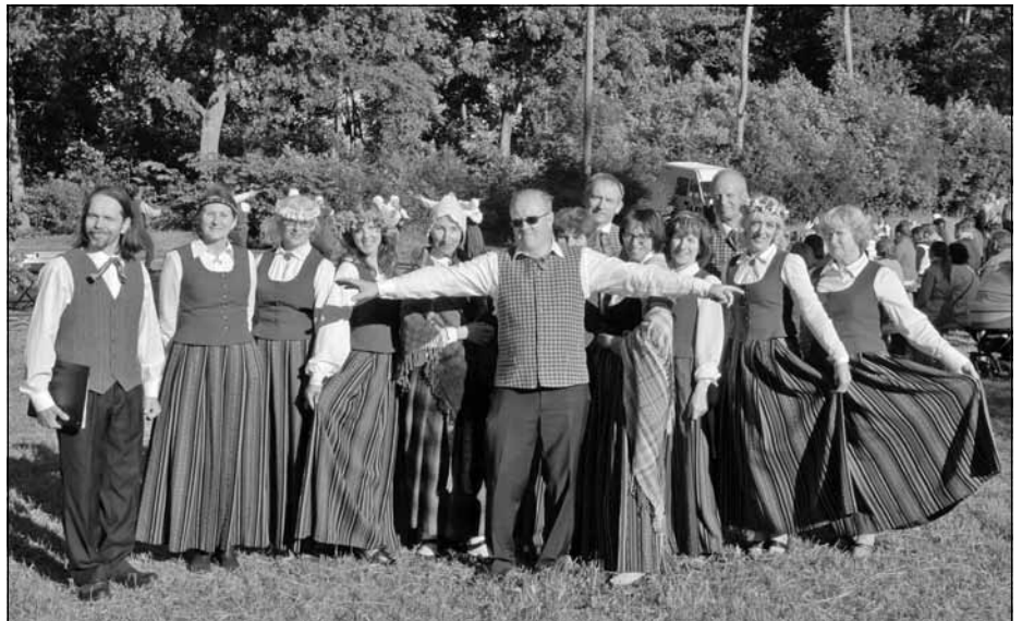
Koris 2016. gada Jāņos Mālpils viduslaiku pilskalna estrādē