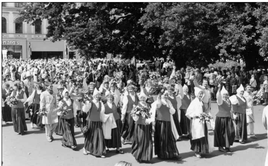
Mālpils koris 1998. gada XXII Vispārējo latviešu Dziesmu un XII Deju svētku gājienā