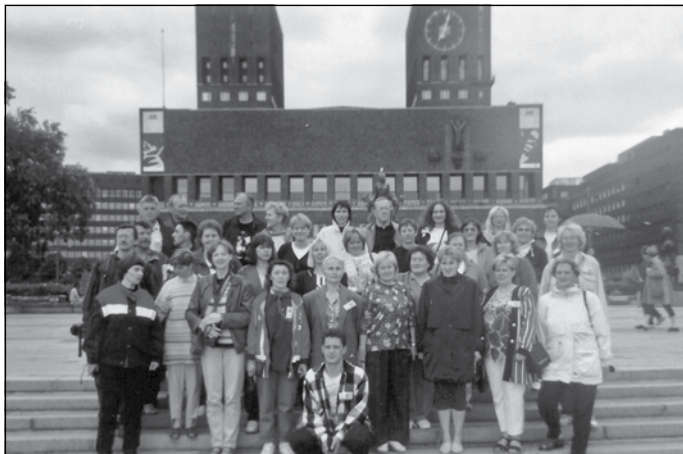
Brauciens uz Ziemeļvalstu dziesmu svētkiem Skien, Norvēģijā, 2000. gads, koris Oslo rātslaukumā