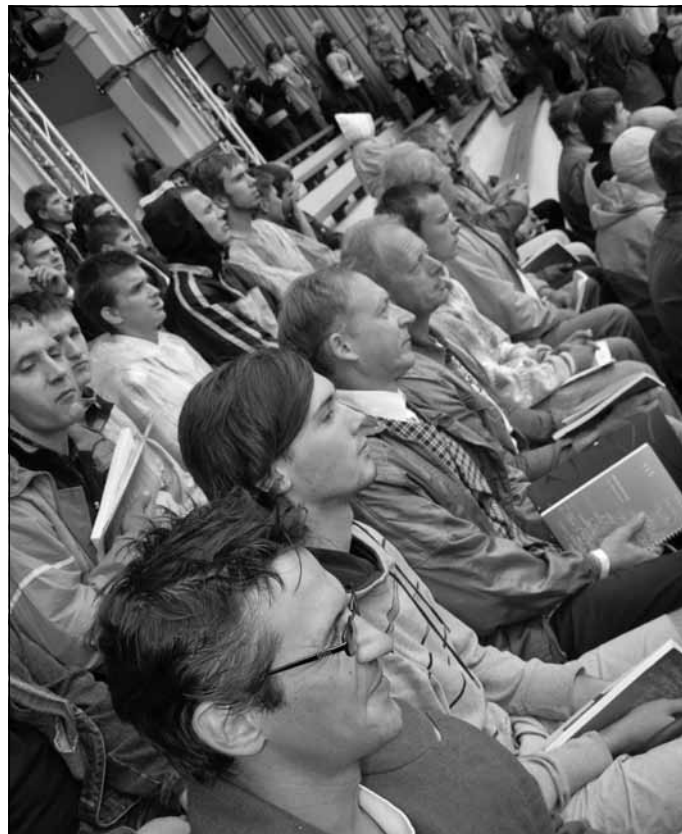
Mālpils koris Rīgas 810-gades svētkos, 2011. gads