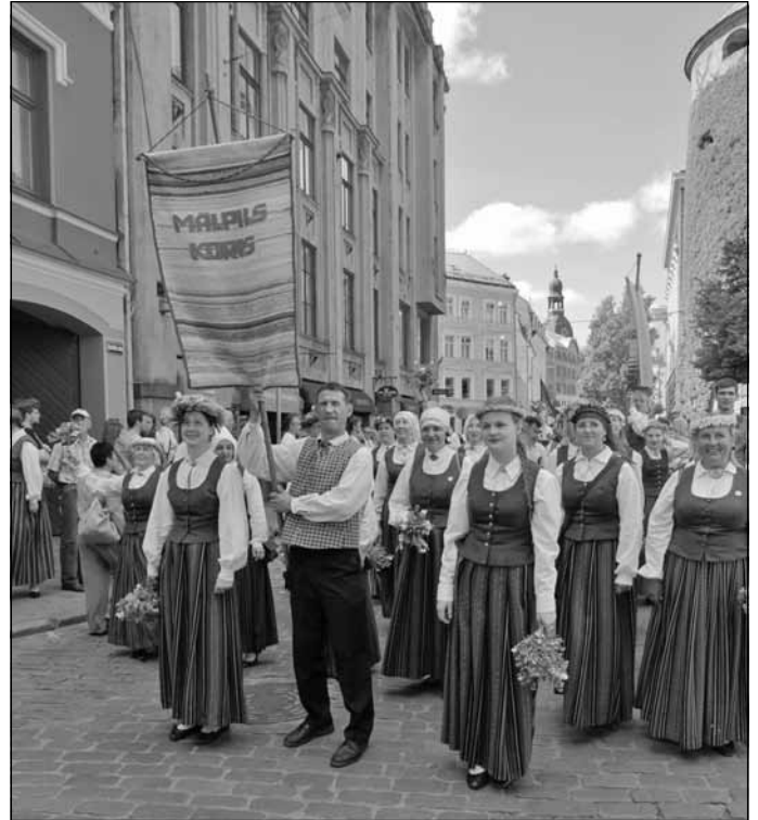
Mālpils koris 2013. gada XXV Vispārējo latviešu Dziesmu un XV Deju svētku gājienā Vecrīgā