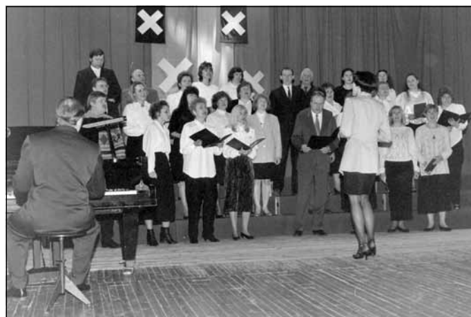
Koncerts Mālpils Kultūras namā, 1998. gada janvāris

l. Ziedonis], nobeigumā ielika vārdus "Ļeņin", oriģinālā bija "Āmen", citādi jau nevarētu atskaņot Dziesmu svētkos. Obligātās nodevas iekārtai bija pašsaprotamas, tas mūs – dziedātājus – ti-