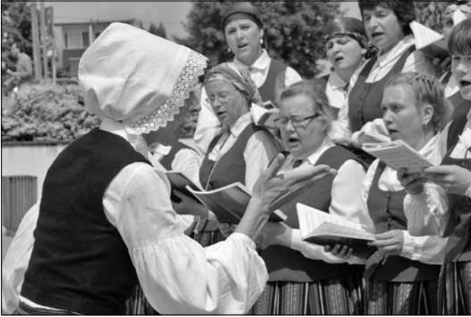
2013. gada pašdarbnieku kolektīvu sezonas noslēguma koncerts Mālpilī