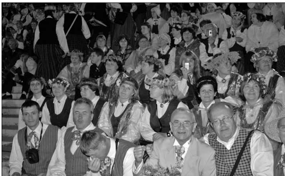
Mālpils koris Rīgas 810-gades svētkos, 2011. gads