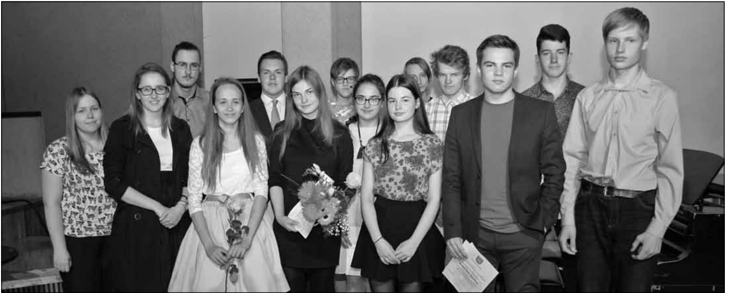
Mālpils novada pašvaldības izglītības iestāžu skolēni, kuri guvuši panākumus starpnovadu, reģionāla, valsts un starptautiska mēroga mācību priekšmetu olimpiādēs, konkursos un sacensībās