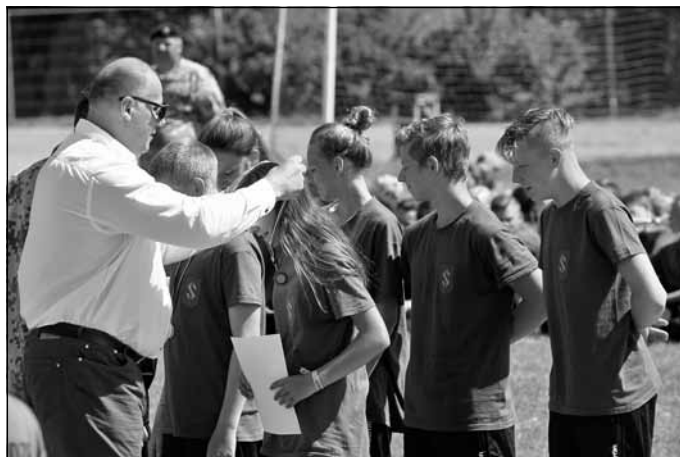
Aizsardzības ministrs Raimonds Bergmanis apbalvo uzvarētājus