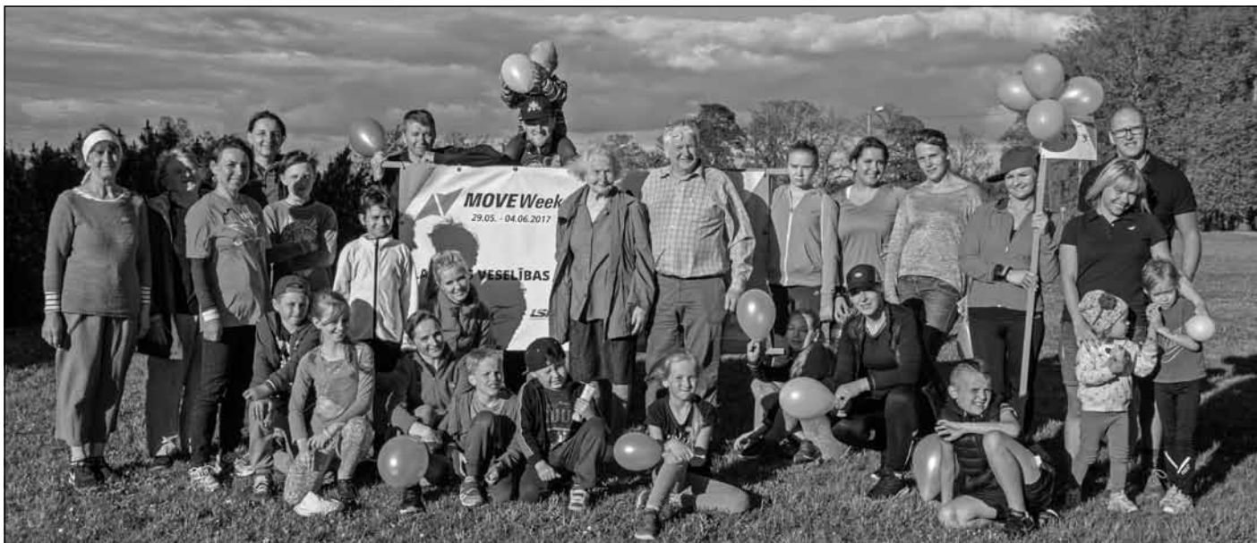
Esam krietni iesaļojuši Mālpils nākotnē! Paldies visiem bērniem, jauniešiem, skolotājiem, darbiniekiem, vecākiem, draugiem, interesentiem, kuri atbalstīja soļošanas akciju! Uz tikšanos nākamajos projektos un akcijās!