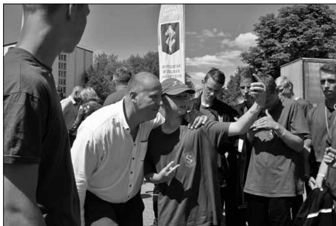
...vai kopā ar ministru uztaisīt selfiju