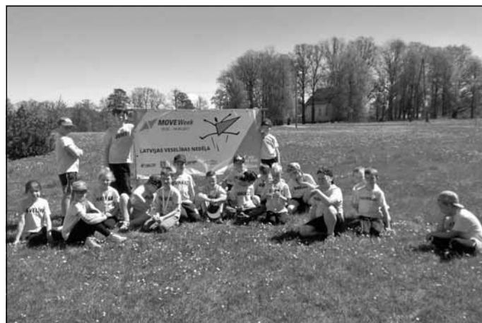
3.b klase palika nepārspēti lēkšanā ar aukliņu. Viņu veikums 33 329 lēcieni.

Īpašu laiku 23. maija vakarā sev rezervēja deju kolektīvs "Sid-