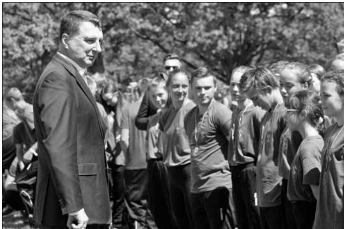
Valsts prezidents Raimonds Vējonis sveic jaunsargus