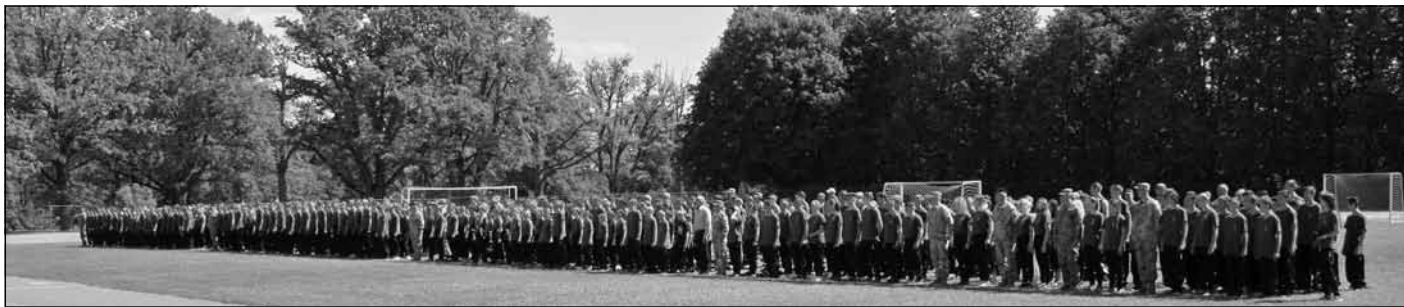
Jaunsargi ierindā sporta spēļu noslēguma ceremonijā Mālpils stadionā, 2017. gada 17. jūnijs