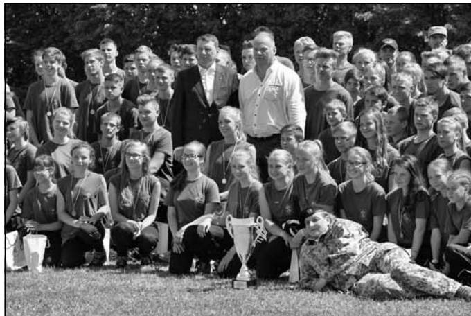
Valsts prezidents un aizsardzības ministrs ar sporta spēļu uzvarētājiem 3. novada nodaļu un nodaļas komandieri