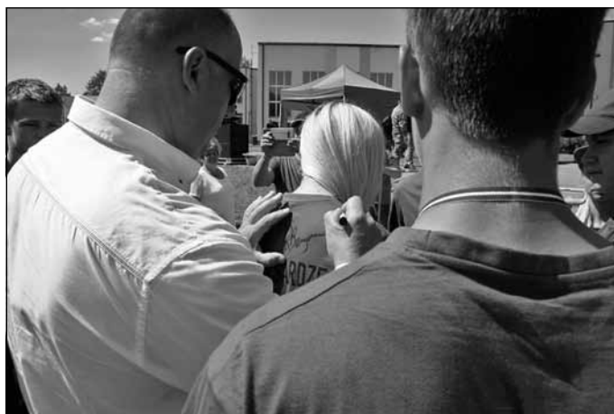
Pēc ceremonijas jaunsargiem bija iespēja iegūt ministra autogrāfu...

“Pirmkārt lielākais ieguvums bija tas, ka mēs bijām Mālpili, jo šeit ir tik piemērota infrastruktūra šāda mēroga pasākumiem. Kopējais nometnes dalībnieku skaits bija ap 600 cilvēku, un mums bija jādomā par to, kur viņus izguldināt, kā paēdināt. Ne visas pašvaldības ir gatavas nodrošināt infrastruktūru tik lielam skaitam jauniešu.