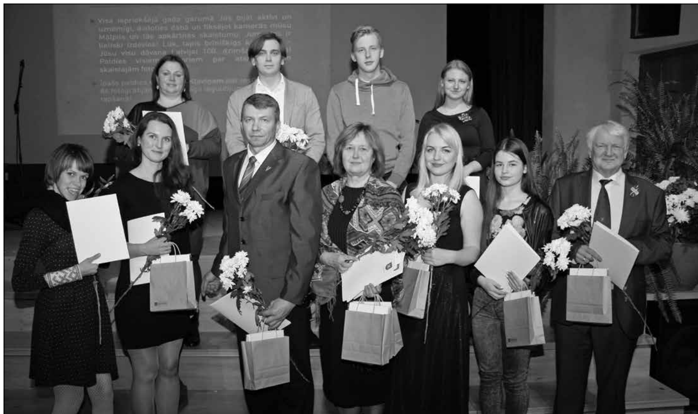
Fotokonsursa "Četri gadalaiki Mālpilī" dalībnieki un kalendāra "Mālpils 2018" fotogrāfiju autori

Visvairāk fotogrāfiju iesūtījuši – Guntars Kļaviņš (86 fotogrāfi-