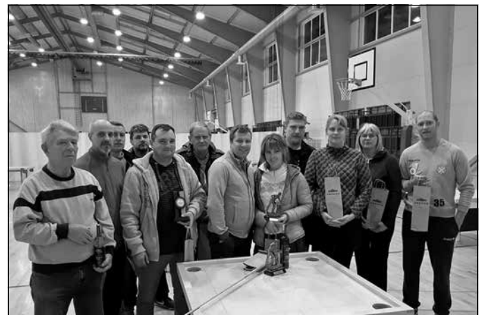
Vīnkalna kausa izcīņa novusā – laureāti