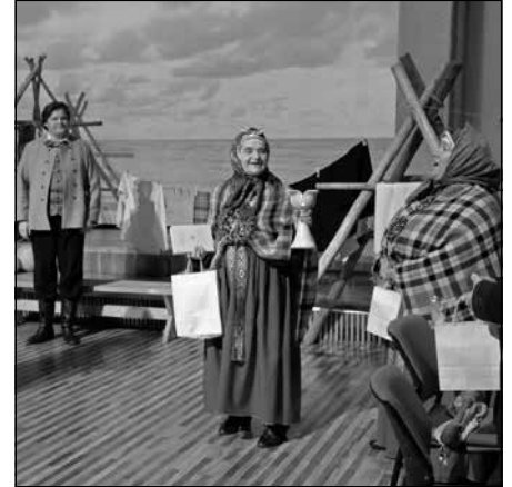
Reiz vientulā krastā...