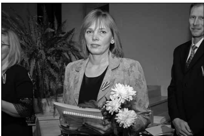
“Gada uzņēmums” – SIA “MADARA 89” (veikals “TOP”)