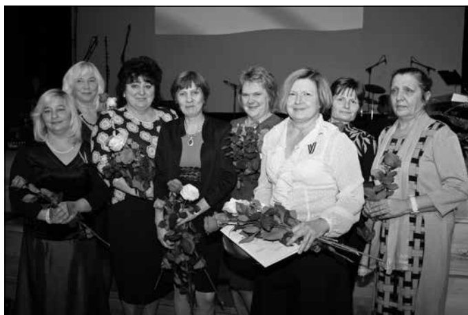
“Gada kolektīvs” – Mālpils sociālās aprūpes centra kolektīvs