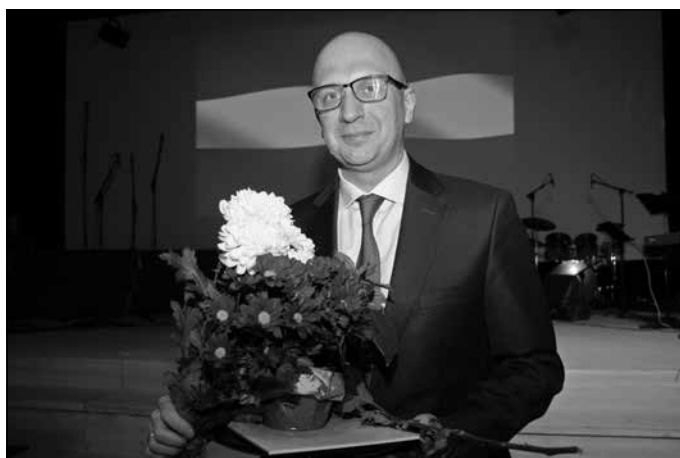
“Gada labdaris” – SIA “KVIST”