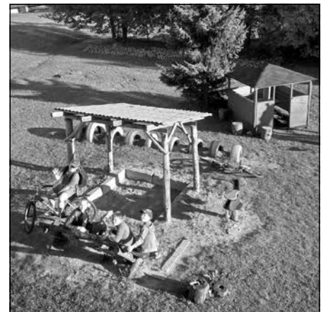
Mēs – Krasta ielai 2