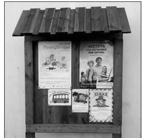
Mēs – Sidgundai

Mālpils novada domes Investīciju un ārējo sakaru daļa