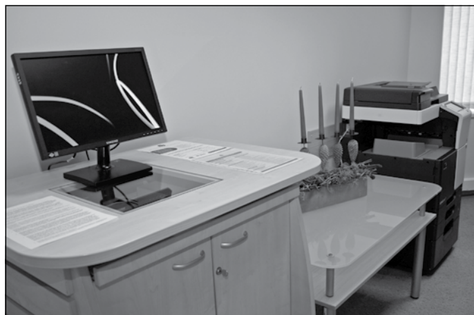
Klientu pašapkalpošanās interneta punkts