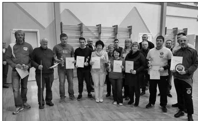
Mālpils kausa izcīņas novusā 2017. gada kopvērtējuma laureāti