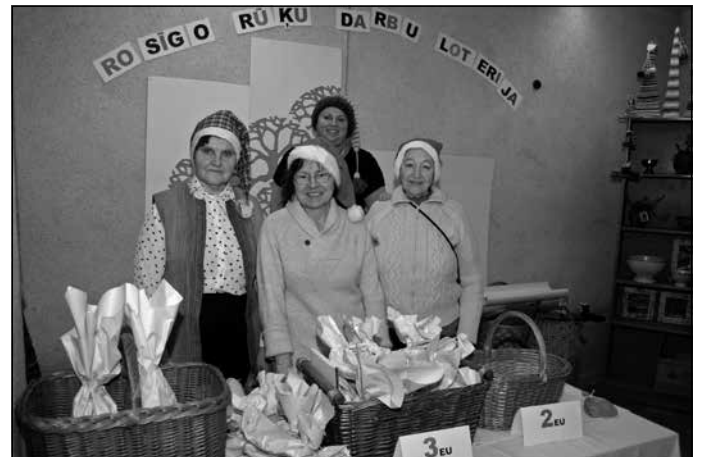
Rosīgo rūķu darbu loterija