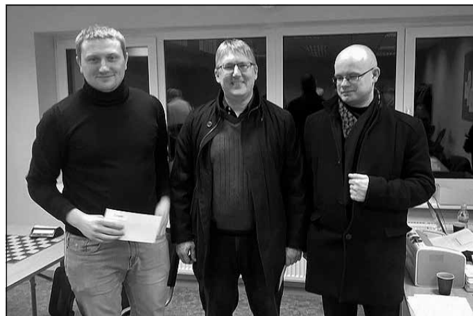
Mālpils domes kausa izcīņas šahā godalgoto vietu ieguvēji