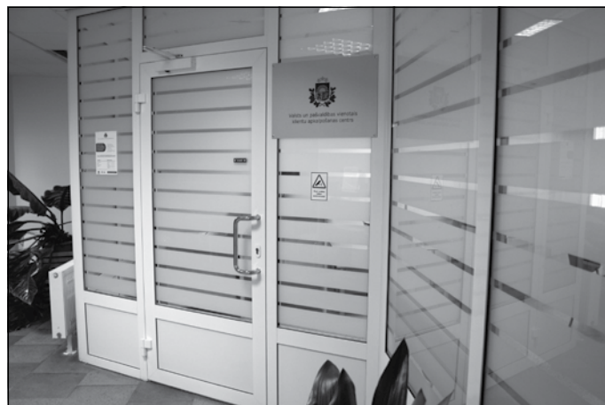
Klientu apkalpošanas centra ieeja (bijušajās bankas telpās)