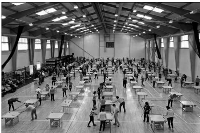
Pasaules kausa izcīņas 10. posms novusā