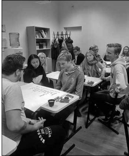
Kopā ar partnerskolu skolēniem