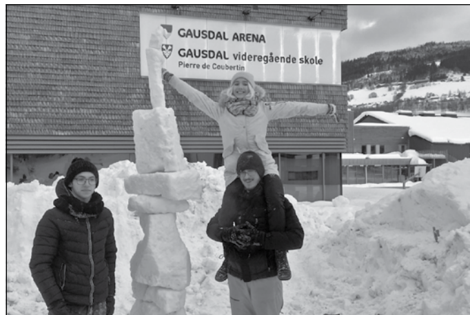
Augstākais sniega tornis uzbūvēts!