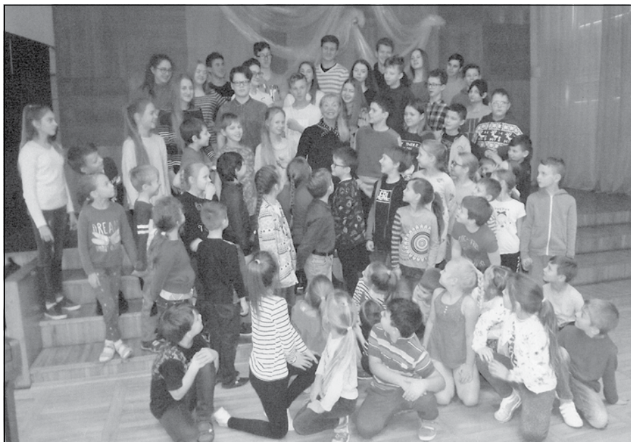
Savu Mālpils kolektīvu vidū