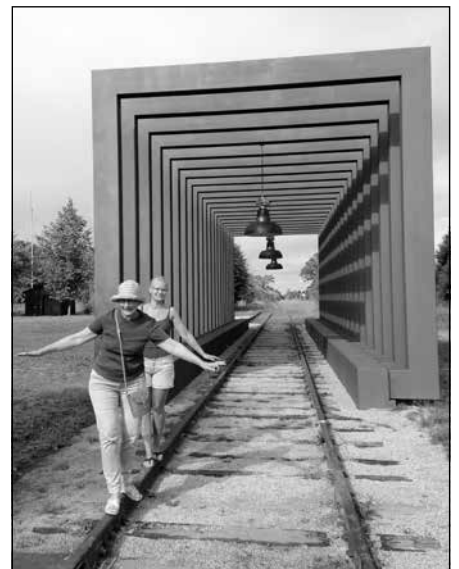
Indra ar meitu Aigu Ķeipenē