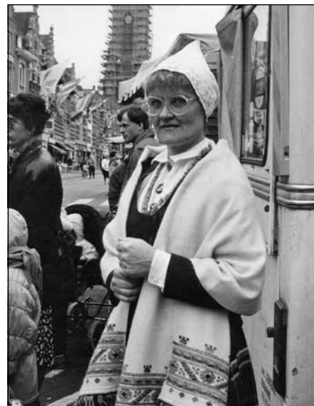
Jana ar dejtājiem Beļģijā