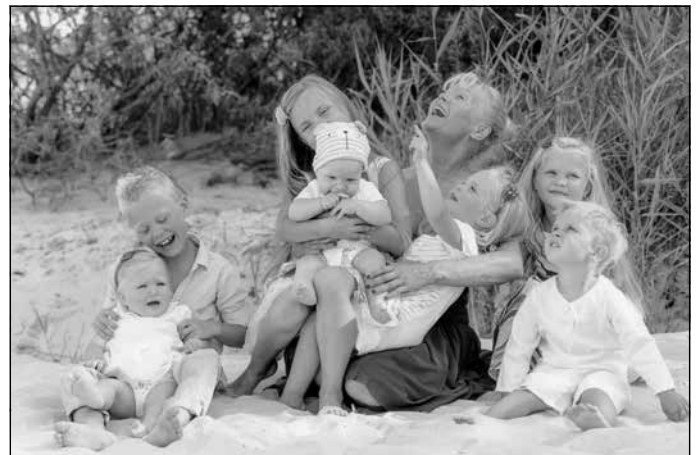
Omīte veselam mazbērnu pulciņam