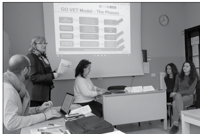
Stāstām kolēģiem par projektā paveikto

Mūsu itāļu kolēģi iepazīstināja projekta dalībniekus ar līdzīgu, šajā reģionā realizētu, projektu ieguvumiem un pieredzi. Tikām uzaicināti uz līdzīga projekta "Horizonts" noslēguma konferenci. Tajā piedalījās vecāki, uzņēmēji, sponsori, projektā iesaistītie skolotāji. Mūs aizkustināja sirma uzņēmēja atziņa par to, cik svarīgi ir iemācīt bērniem saglabāt piederību savai zemei, dzimtajai vietai un rosināt ikvienu savas zināšanas, prasmes un idejas vel-