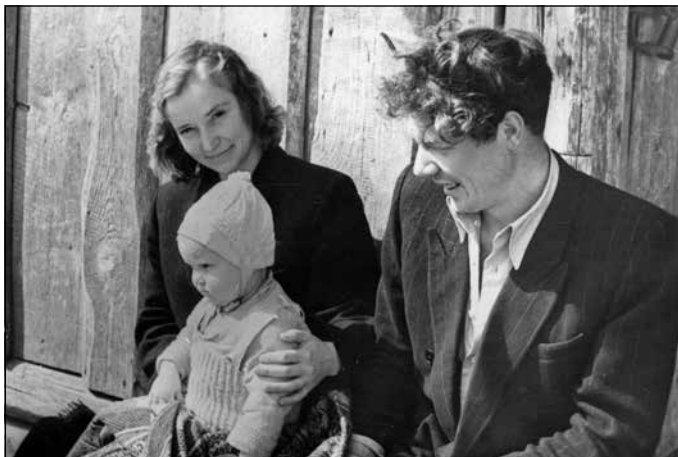
Mazā Lilitiņa ar vecākiem