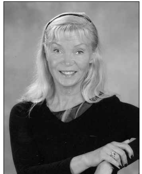
Lilita vidusskolniece? Nē! Foto... pirms gada!