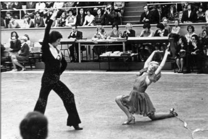
19 gadi un pirmie lauri