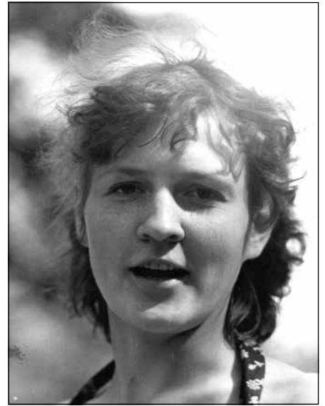
Indra pirmajā darbavietā Brīvdabas muzejā