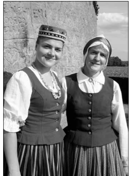
Indra ar meitu Gunu