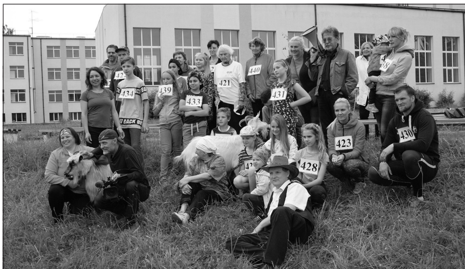
Filmēšanās dalībnieki kopā ar producentu un operatoru