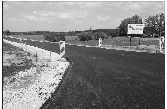
Rūpniecības iela Mālpilī