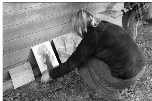
Gatavi pirmie darbiņi, kas tapuši Esmeraldas Tāles vadītajā Oto Skulmes glezniecības darbnīcā.