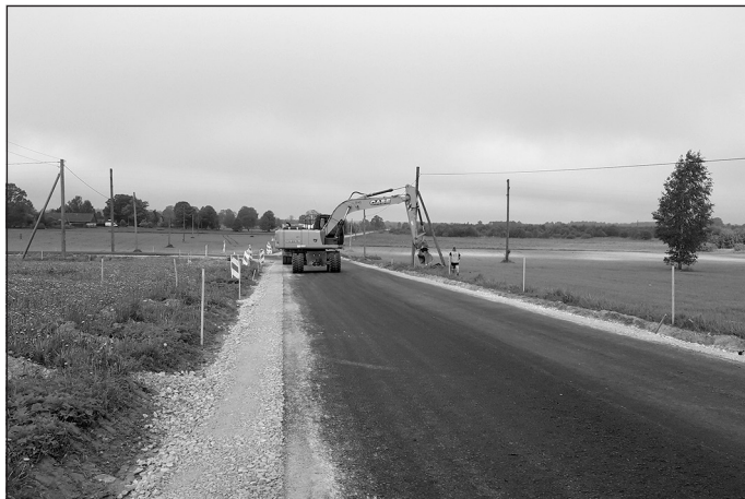
Rikteres iela Sidgundā

Piena ielā Sidgundas ciemā Mālpils novadā būvdarbi vēl nav uzsākti. Projekta sagatavošanas posmā 4 uzņēmēji parakstīja apliecinājumu par interesi, kopā nodrošinot, ka tiks radītas vismaz 6 jaunas darba vietas un veiktas investīcijas savos nemateriālajos ieguldījumos un pamatlīdzekļos vismaz EUR 500 000. Kopējais plānotais projekta finansējums, par ko tika noslēgts līgums ar CFLA 305 400,76 EUR, tajā skaitā ERAF finansējums 220 575,00 EUR, valsts budžeta dotācija 21 206,44 EUR un pašvaldības finansējums 63 619,32 EUR. Arī šīs ielas pārbūvei visi iepirkumi ir veikti un noslēgti līgumi ar visiem pakalpojumu sniedzējiem, projekta īstenošanas kopējās attiecināmās izmaksas ir EUR 215 685,54 EUR, pašvaldībai šī projekta īstenošanai jānodrošina līdzfinansējums EUR 42 166,52.