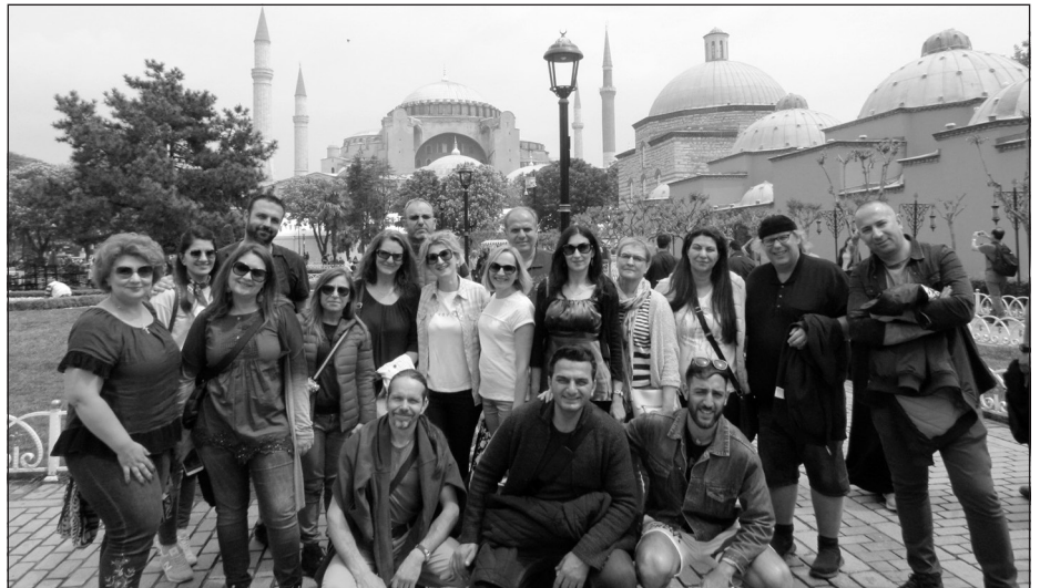
Kopā ar partnervalstu kolēģiem