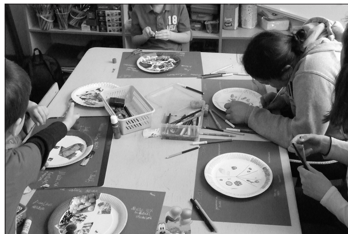
Nodarbības PII "Māllēpīte"