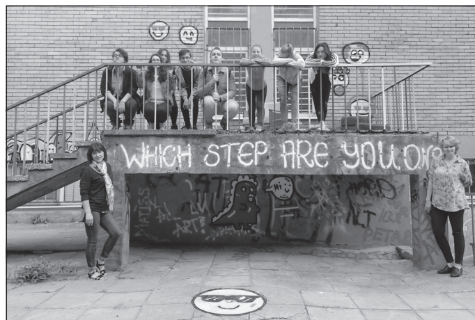
Mūsu vadītā foruma darbs

Dalībnieku iespaidus apkopojā Ilze Rauska