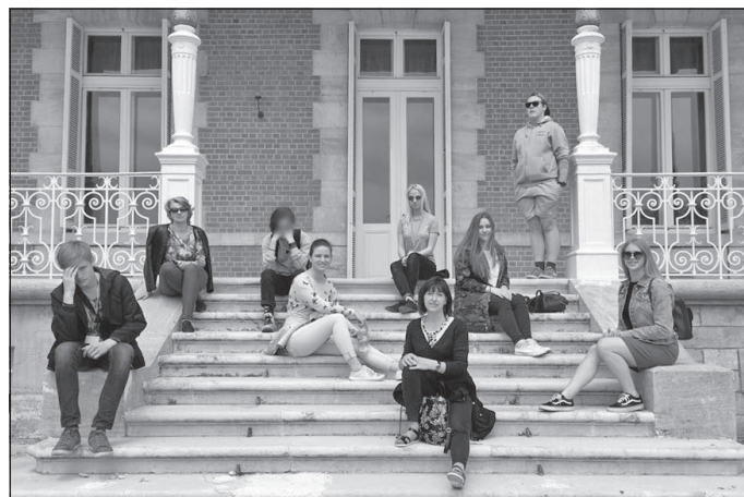
Uz Bulgārijas pēdējo valdnieku pils kāpnēm