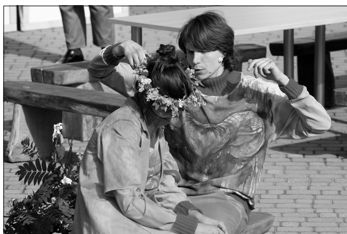
Ieviņa un Kārlēns