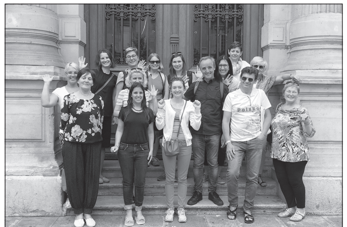
Kopā ar kolēģiem no Francijas, Austrijas un Polijas