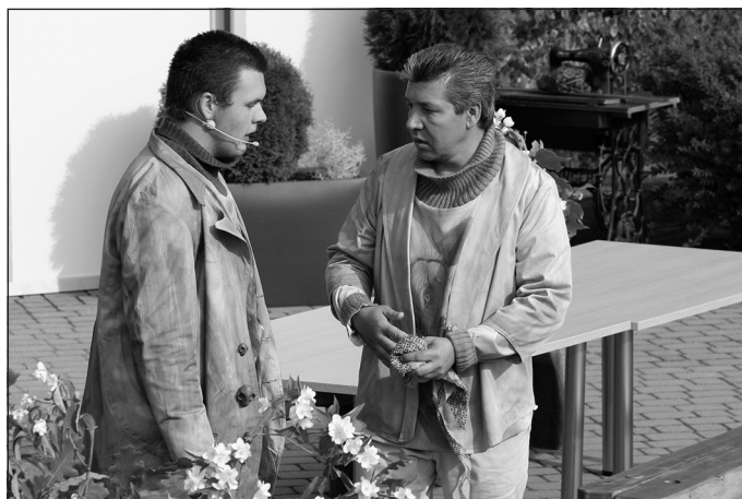
Rūdis un Dūdars

gadiem. Man šķiet, ka viens no iemesliem, kāpēc "Skroderdienas Silmačos" joprojām tik populāras, ir cilvēku ilgas pēc latviskās identitātes mūsdienu globalizācijas apstākļos.