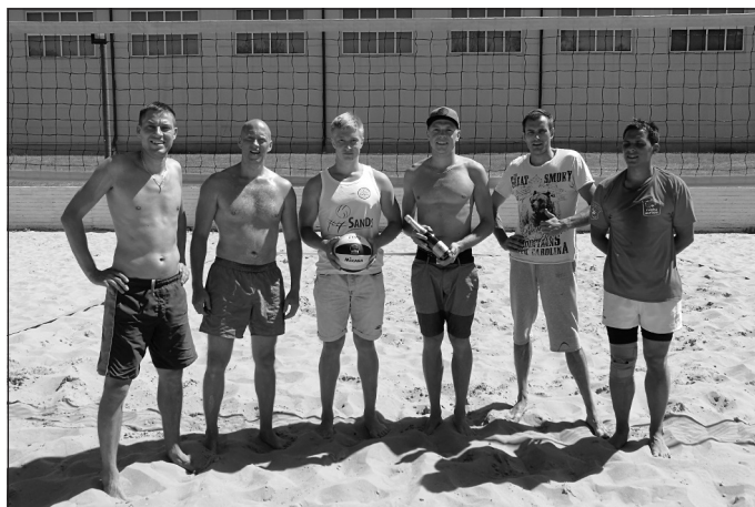
Godalgoto vietu ieguvēji pludmales volejbola čempionātā

Sporta darba organizators Ģirts Lielmežs