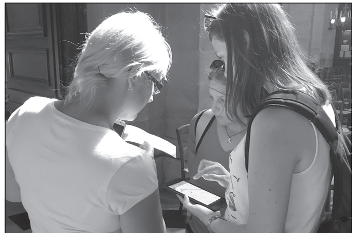
"Dārgumu mednieki" jeb slēpņošana