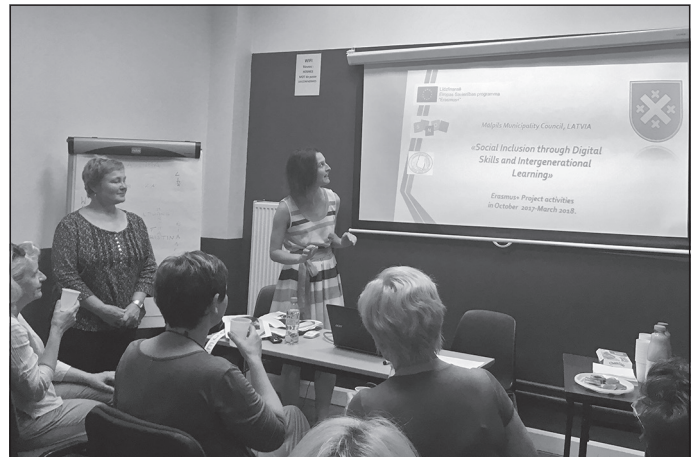
Prezentējam savu pieredzi