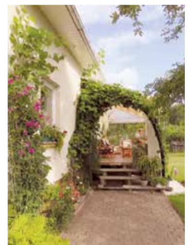
Rītausmas ielā 3, Lādezerā, Limbažu pagastā.

Augu stādījumi norobežoja teritoriju gan no ielas puses, gan no kaimiņiem, tādēļ sajūtāms kā klusā dārza oāzē. Saimnieki dzīvžogu veidošanai bija izmantojuši dažādu ziedošo augu grupas, un norobežojošie stādījumi dārzu sadalīja vairākās zonās. Bija vērojams arī neliels dīķītis ar ziedošām ūdensrozēm, plašā teritorijā ziedēja visdažādākās vasaras puķes. Blakus milzīgiem jāņogu krūmiem un ēdamajiem sausseržiem sava vieta bija atradusies pat valrieksta kokam.