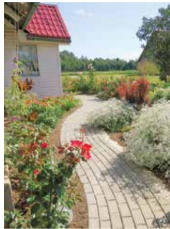
“Veccēverti” Viļķenes pagastā.