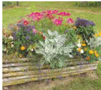
“Zītari” Pāles pagastā.