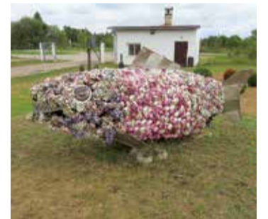
Uzņēmums SIA “Baltijas zivis – 97”.