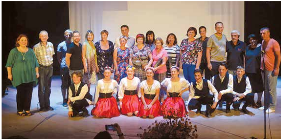
Haragauli teātri pirmajā vakarā mūs sveica gan pilsētas vadība, gan bērnu deju kolektīvu dalībnieki.