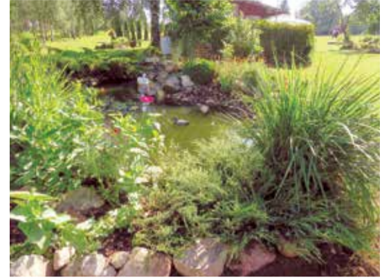
Katvaru pagasta “Rūjas”.