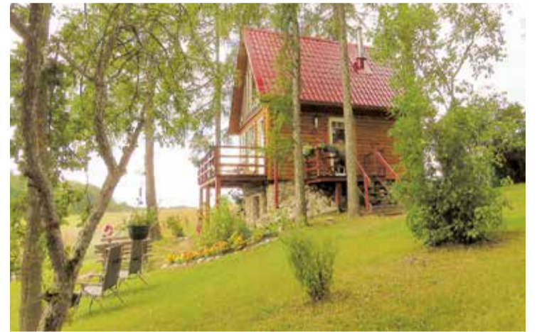
Viļķenes pagasta “Reiniši”.