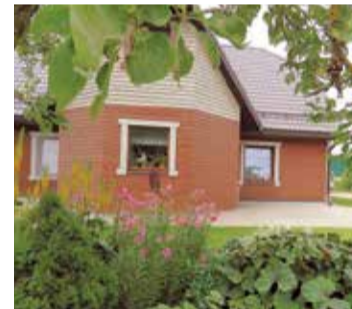
Pāles pagasta “Spricēs”.