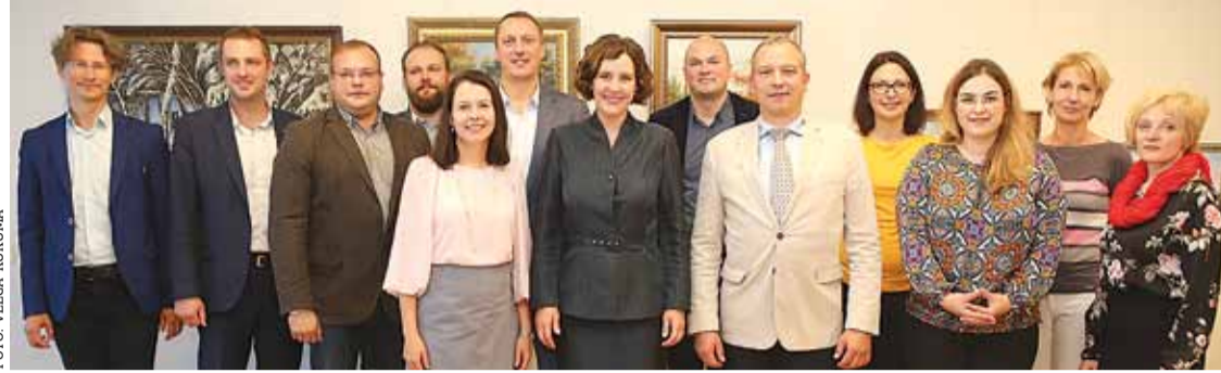
Ar finanšu ministri tikās domes vadība, pašvaldības speciālisti un uzņēmēji.

20. septembrī Ķekavas novada domes vadība un novada uzņēmēji tikās ar finanšu ministri Danu Reiznieci-Ozolu, lai pārrunātu Latvijas ekonomiskās attīstības tendences, politikas izaicinājumus un valdības politikas prioritātes un to ietekmi uz pašvaldības sniegto pakalpojumu nodrošināšanu un uzņēmējdarbības vides attīstību novadā.