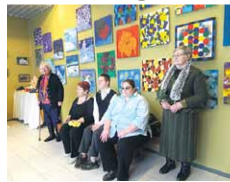
Dienas centra jubilejas izstādes atklāšana

cību. Pasākumā uzstājās arī dienas centra Gaismas iela dziedātāji.