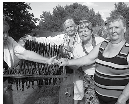
Cepot sklanda raušus un izgaršojot zivis