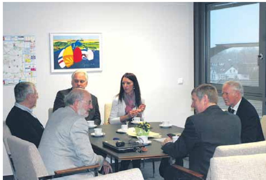
Ķekavas novada pašvaldības delegācijas tikšanās ar Rotary pārstāvjiem Bordesholmā

Rotary kluba pārstāvji atzina, ka latviešu jaunieši ir paveikuši lielu darbu un