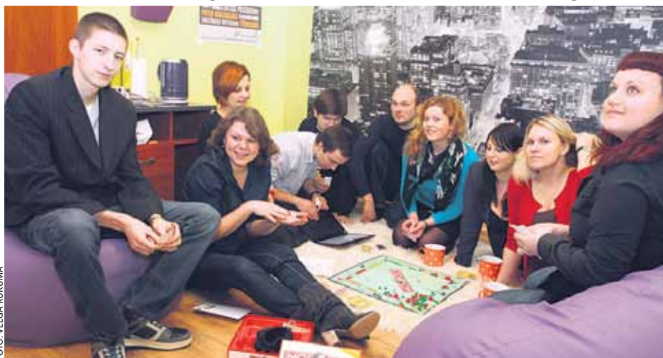
No ĶNKA jauniešu centra atklāšanas pasākuma

Kopš 2012. gada maija aktīvu jauniešu pulciņš īsteno projektu The taste of democracy jeb Izgaršo demokrātiju, ko finansē programma Jaunatne darbībā . Projekta ideju radīja jaunieši, pateicoties iepriekš veiktajiem starptautiskiem un vietēja mēroga jauniešu projektiem.