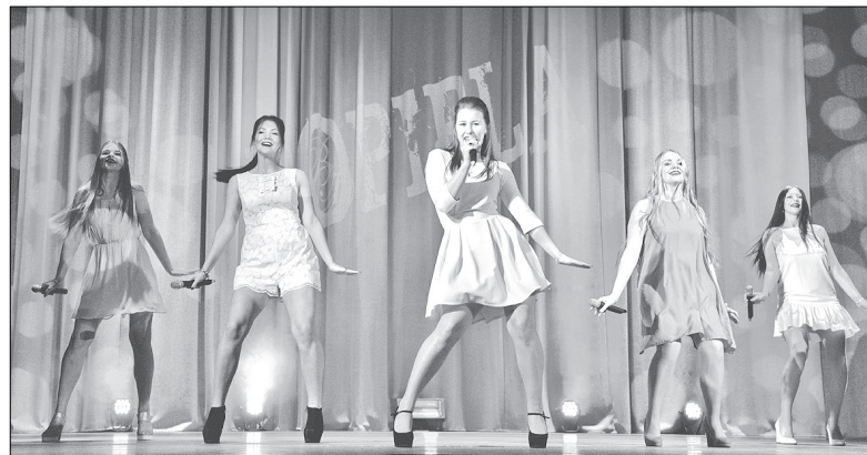
Rojas vidusskolas 12. klases meitenes, kuras piedalījušās „Popielā” daudzu gadu garumā, šogad atvadījās no šī pasākuma, attēlojot grupu The Saturdays.

sirsniņu pateicību par saldo un garšīgo atbalstu uzvarētājiem izsakām „Popielas” draugiem – veikalam „Ķipītis”, kafējnīcai „Dižmare” un veikalam „top!”. Par skaistajām gaismām paldies Marekam Štālam. Pasākuma dalībnieki priecājas par notvertajiem fotomirklītiem, par ko savukārt paldies Andrim Zemelam.