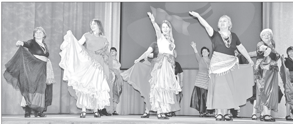
Uzstājas mūsu tuvākās kaimiņienes – Mērsraga „Silvas”

Krāšņi tērpi, mirdzošas acis un pāri visam nebeidzams deļotprieks, tā pāris vārdos varētu raksturot šī krāšņā koncerta dalībniekus. Deļotāju vecums visdažādākais, no dāmām pašos spēka gados, līdz pat sirmām kundzītēm cienījamā vecumā. Un kas par to, ka dažkārt iesāpās šur un tur, ka reizēm aizmirstas, kur noliktas brilles vai sajūk deļas solis! Galvenais ir kopā būt, meļinājumos, koncertos, jubileju reizēs, ekskursijās un teātru apmekļojumos. Kā atzīst Siguldas „Preilenes” – lai gadi pagaida, jo sirds vēl jauna, un slavēno Siguldas spieķi šīs dāmas pielieto vien kā deļu elementu.