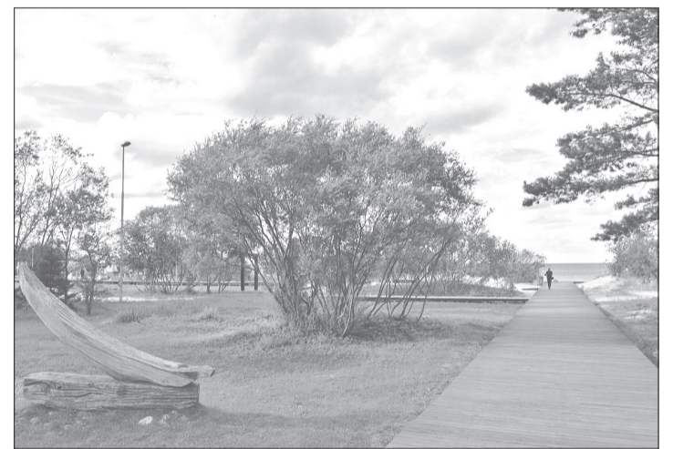
Jau pavisam drīz pa Rojas pludmales laipām varēs pastaigāties arī naktī.

Projekta Nr. 16-08-FL06-F043.0202-000001 „Apgaismotas pastaigu takas izveide Rojas pludmalē” kopējās izmaksas ir 136 650,72 eiro, Eiropas Jūrlietu un