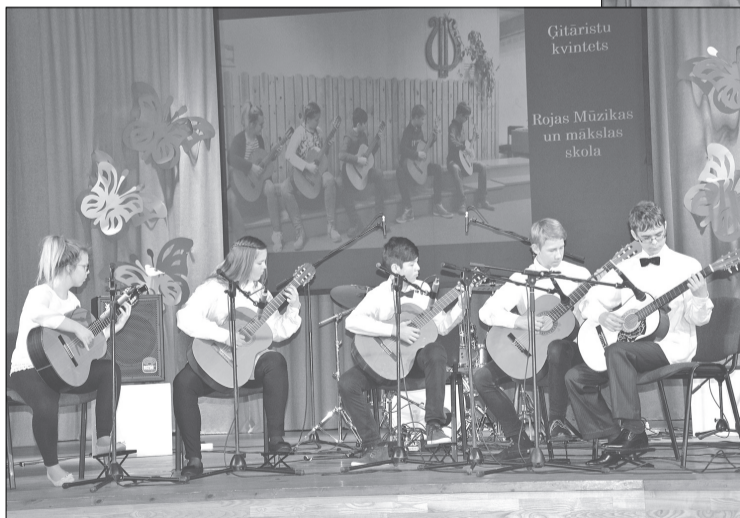
Uzstājas 1. vietas ieguvēja – Rojas MMS ģitāristu kvintets.

dziesmas. Gribētu šim konkursam turpmāk novēlēt vairāk akustisko muzicēšanu. Tur, kur nav vajadzīga elektronika, noteikti var iztikt bez mikrofoniem. Ir jau pašlaik skaļums modē, bet mūsu atbildība ir arī mācīt klausīties, un ir lietas, kas labi akustiski skan pašas par sevi un māca mūziķiem pilnīgi citu šo akustiskās muzicēšanas sajūtu. Tā ir lieta, kas Latvijā nav pašā labākajā līmenī, jo mums vispār ir tikai divas labas akustiskās koncertzāles – tā ir Gors Rēzeknē un „Dzintaru” koncertzāle Liepājā. Apzinos, ka žūrijas vērtējums ir ļoti subjektīvs, jo mūzika un māksla ir lietas, ko objektīvi novērtēt nevar,