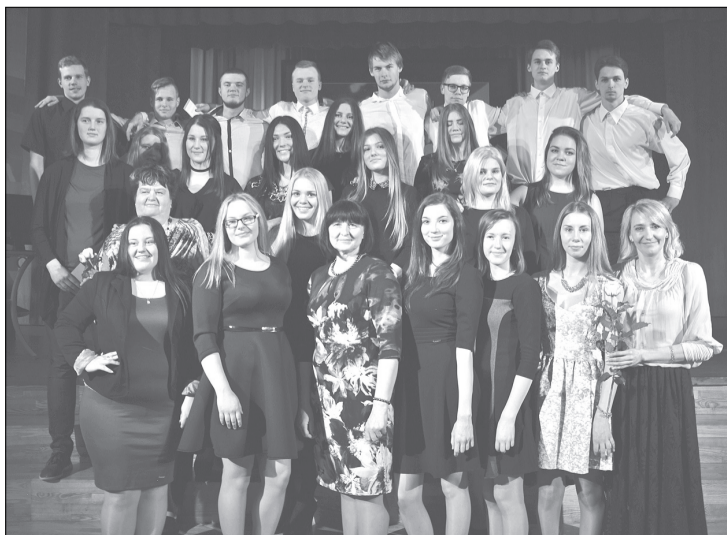
Vēl pavisam nedaudz un šie jaunieši kļūs par mūsu skolas absolventiem.