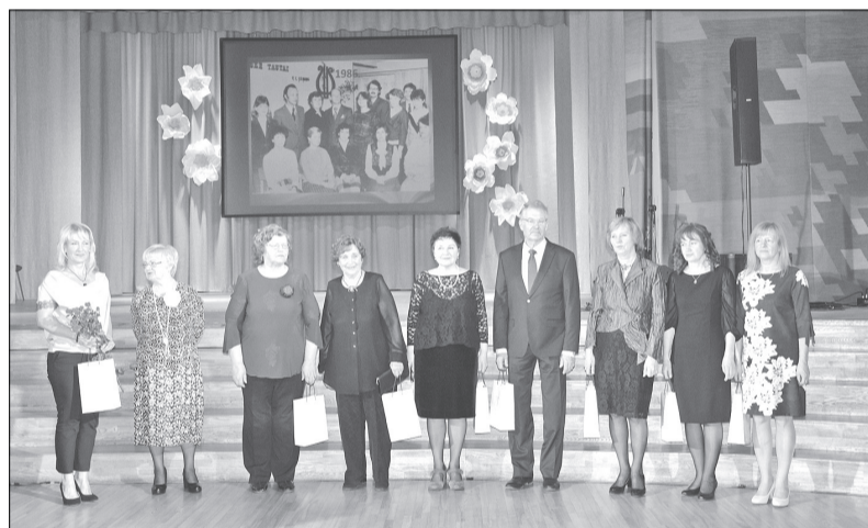
Īpaša pateicība arī bijušajiem Mūzikas un mākslas skolas pedagogiem.