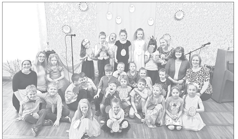
Konkursā ieguvēji bija visi – gan bērni, gan pedagogi.