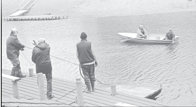
Vīri ar žākaru vēl pārmeklē upes gultni.