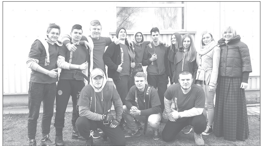
Rojas vidusskolas „Enkura” komanda.