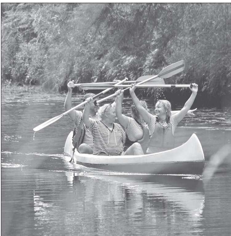
Uzticamākā Rojas upes svētku dalībnieku komanda „Pūces dobums”.