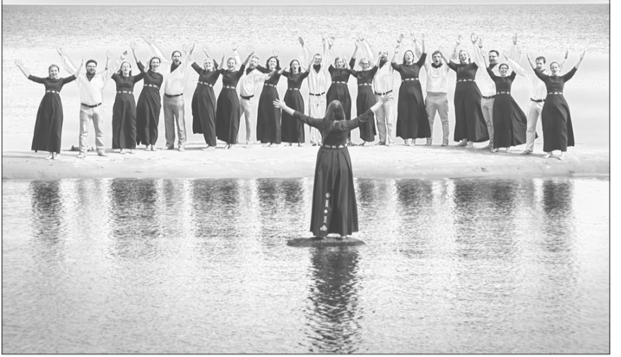
Koris „Norise”. Neatkarotjami skaists un emocionāls mirklis pēc koncerta Kaltenes baznīcā, kas iespējams tikai skaistajā Kurzemes jūrmalā.