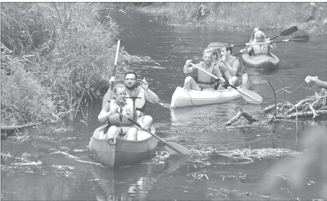
Jautrie un dziedošie laivotāji.

Aizvadīts vēl viens pasākums vasaras nedēļas nogalē – Rojas upes svētki! Jau ceturto gadu notika nesteidzīgs, atraktīvs laivošanas brauciens pa Rojas upi.