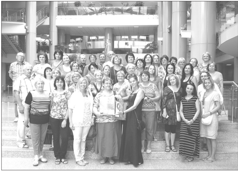
Pieredzes apmaiņas braucienu dalībnieki Baltkrievijas Nacionālajā bibliotēkā.

Trīs dienas augusta sākumā Rojas novada bibliotēkāres izbaudīja Talsu Galvenās bibliotēkas organizēto pieredzes apmaiņas ceļojumu uz Baltkrieviju: Vitebska-Orša-Minska.