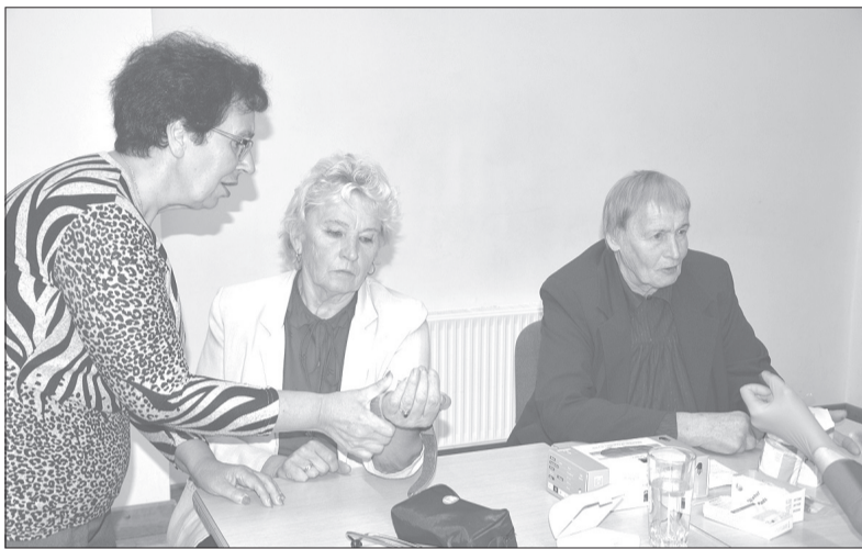
Pasākuma apmeklētājas labprāt izmantoja iespēju izmērīt asinsspiedienu un noteikt cukura līmeni asinīs.