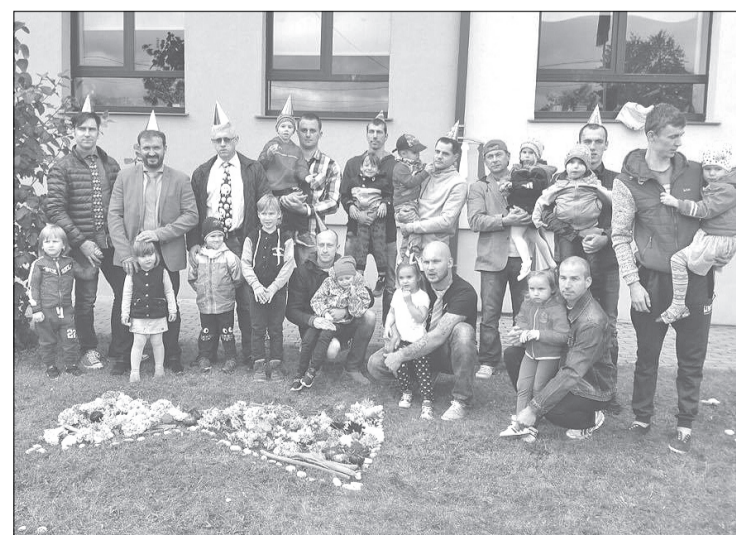
Katram bērnam ir svarīgs laiks, ko viņš pavada kopā ar vecākiem.