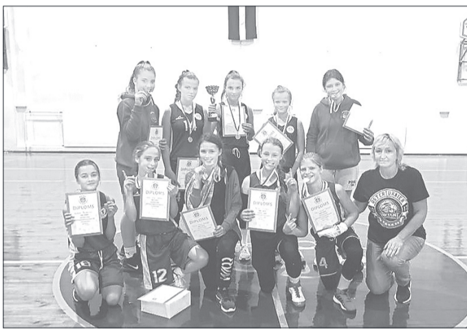
Rojas komanda pēc apbalvošanas.