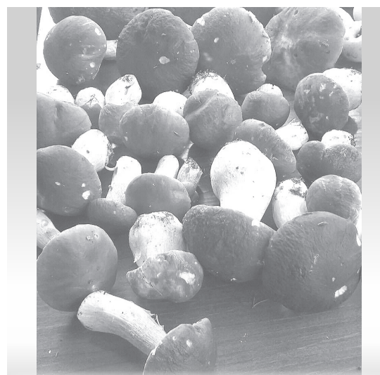
Latvijā iestājies baraviku laika dullums! Izmantojiet to – ejiet visi bekot!