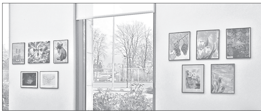
Rojas jauno mākslinieku darbi aplūkojami ASV vēstniecībā Rīgā.

Turpinājumā abi pedagogi un mākslinieki strādāja arī ar Interesu izglītības programmas Vizuāli plastiskā māksla audzēkņiem. Šeit bija sagata-