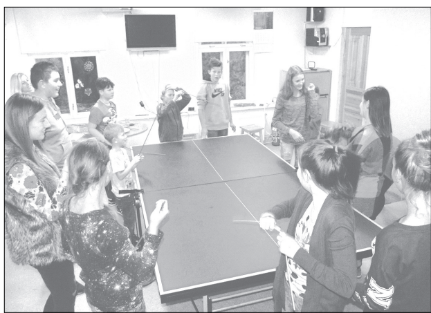
Mājīgajās BJIC „Varavīksne” telpās jauniešiem allaž ir, ar ko nodarboties.

Skatoties fotogrāfijas no pasākuma „Mīlu Tevi, Latvijai!”, bērni atcerējās, ar kādu interesi, aizrautību atbildējuši uz jautājumiem par Latvijas vēsturi, dabu, minējuši novadu nosaukumus un noteikuši dažādu Latvijā ražotu produktu