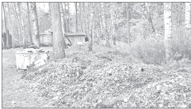
Kreisajā pusē redzams uzraksts, kas vēsta, kurā vietā jāber lapas.