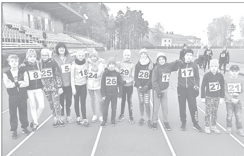
24. oktobrī kopā ar treneri tika noskrieti pirmie „Rojas aplī” uz atjaunotā stadiona skrejceļa.