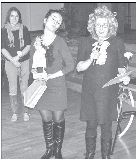
Sabiles bērnu bibliotēkas darbinieču atrakcīvais apsveikums.

Nekustamā īpašuma nodokļa maksātāju ievēribai!