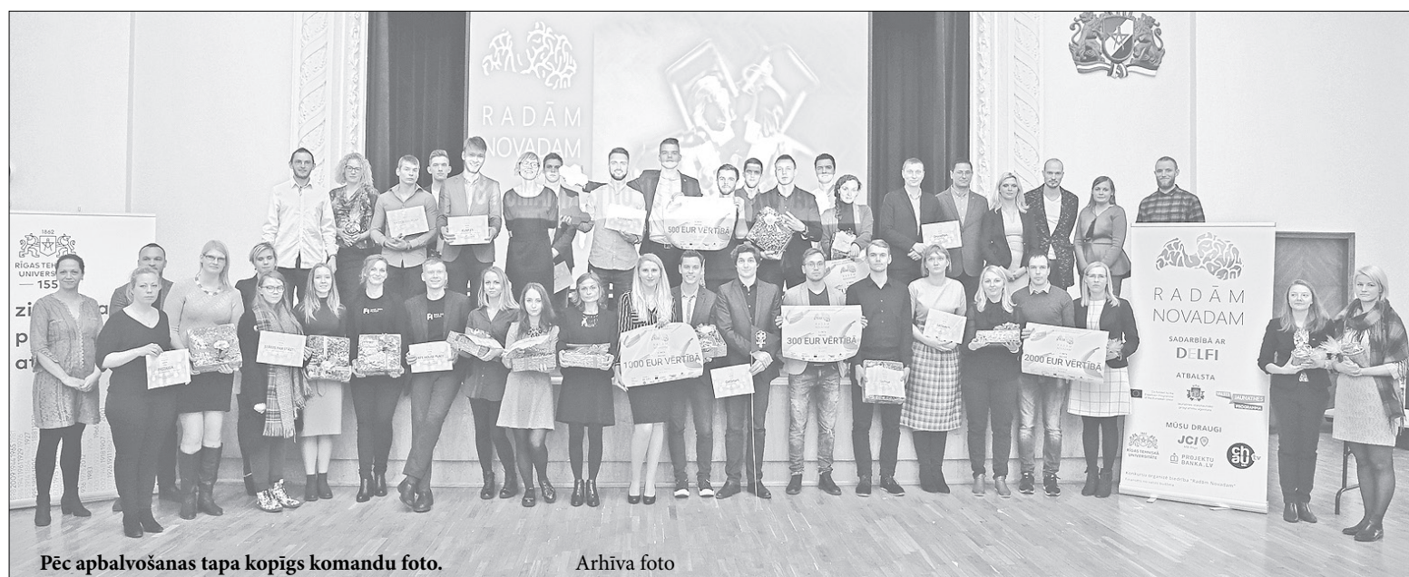
Pēc apbalvošanas tapa kopīgs komandu foto.