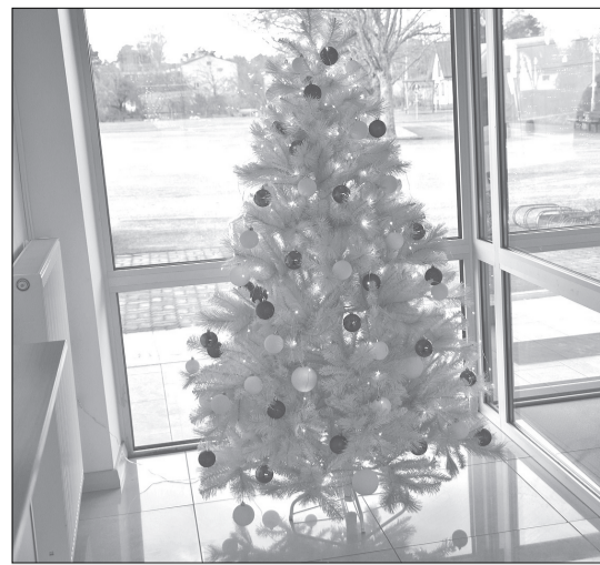
Šādi izrotāta egle sagaida katru apmeklētāju Rojas novada domē.