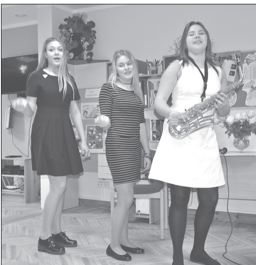
Uzstājas Rojas Mūzikas un mākslas skolas trio.