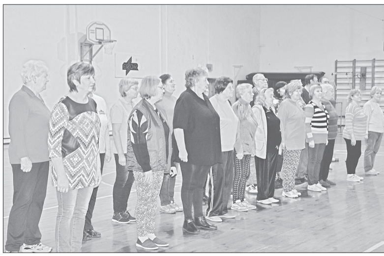
Invalidu biedrības biedri sporta dienai gatavi.