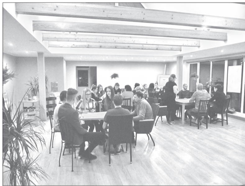
Projekta dalībnieki viesu namā „Akmeņi”.

Projekts īstenots Izglītības un zinātnes ministrijas Jaunatnes politikas valsts programmas 2017. gadam valsts budžeta finansējuma ietvaros.