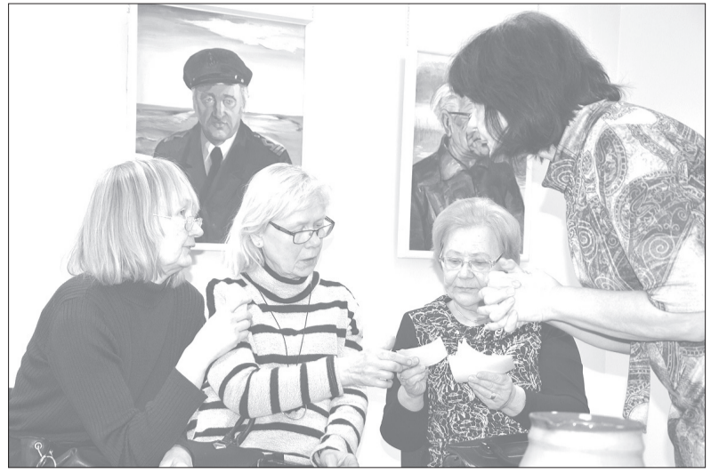
Lielu interesi izraisīja līdzīgas fotogrāfijas, kurās katrs no klātesošajiem atpazīna kādu savējo.