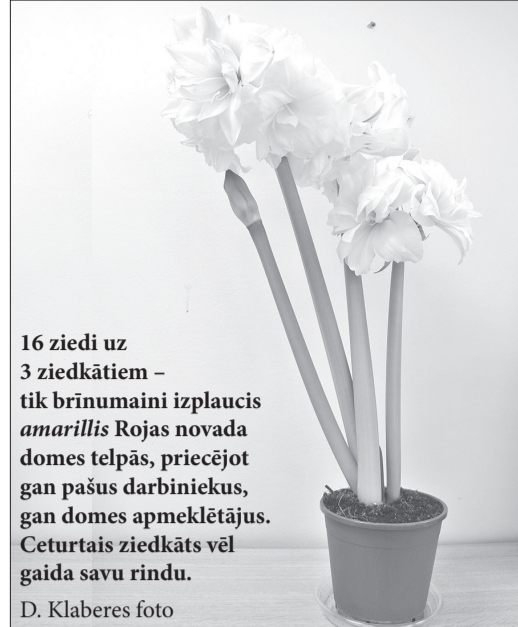
16 ziedi uz 3 ziedkātiem – tik brīnumaini izplaucis amarillis Rojas novada domes telpās, priecējot gan pašus darbiniekus, gan domes apmeklētājus. Ceturtais ziedkāts vēl gaida savu rindu.