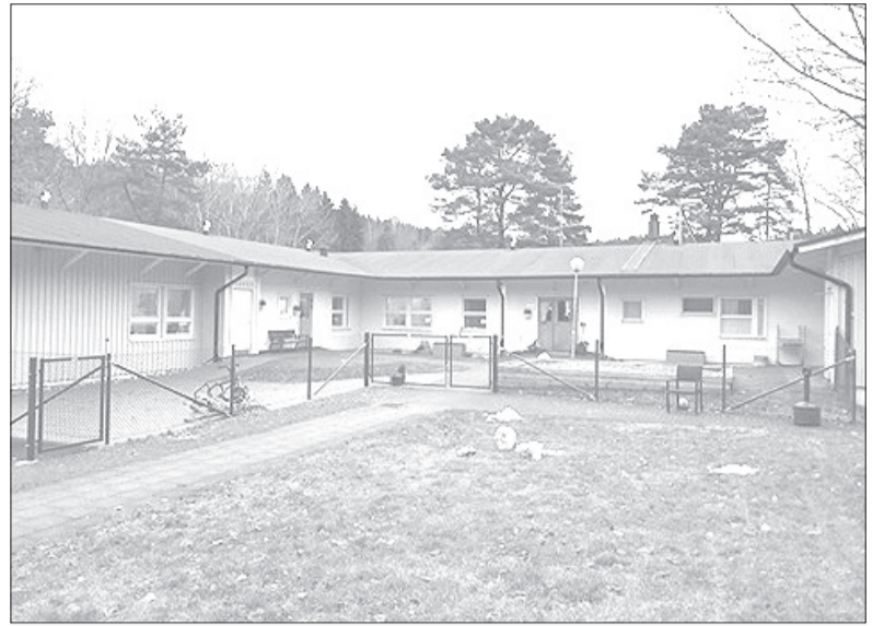
Sociālās rehabilitācijas ēka Gēteborgā.

Zviedrijā lielu daļu sociālos pakalpojumus sniedz nevalstiskās organizācijas, no kurām pašvaldības pārņem pakalpojumus, un šis modelis labi strādā. Latvijā vēl joprojām ļoti pietrūkst kvalitatīvu, daudzveidīgu, uz klientu vaja-