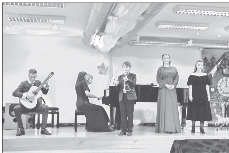
Koncerta dalībnieki pārsteidza klausītājus ar virtuozitāti un izcilu muzikalitāti.