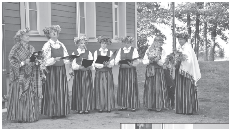
Par jestro apdziedāšanu paldies sieviešu kora „Kalva” meitenēm.

atkal pieskandina bērnu balsis. Skoliņā mācās 40 bērni, pamazām 2.stāvs tiek pārbūvēts un izveidotas jaunas klašu telpas. Skola turpina būt ciema sabiedriskais centrs līdz 2005. gadam.