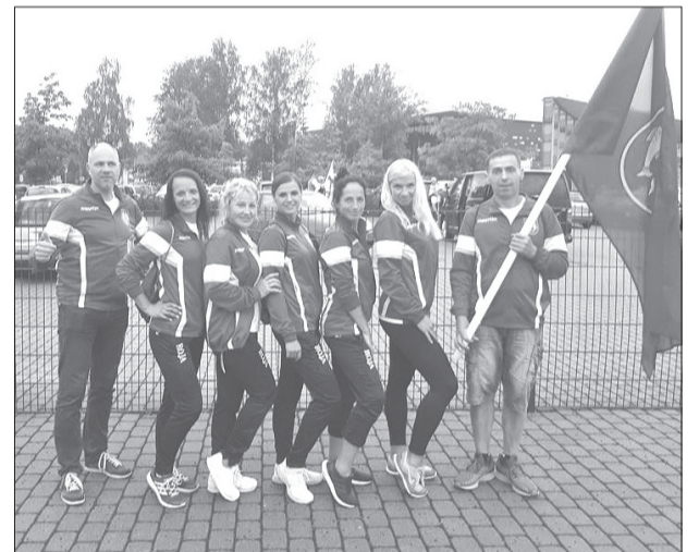
Rojas vieglatlētu komanda (nepilnā sastāvā). Albuma foto

Arī Rojas novads piedalījās LSVS 55. sporta spēlēs 7 sporta veidos - vieglatlētikā manēžā Rīgā (7 dalībnieki), pavasara krosā Jēkabpilī (6 dalībnieki), telpu futbolā Valmierā (10), novusā Ķekavā (6), zolitē Ķekavā (2), galda tenisā Salaspilī (4) un vieglatlētikā Jelgavā (13). Vieglatlētikas sacensībās, kuras notika no 21.–22. jūnijam Jelgavā, Zemgales Olimpiskajā stadionā, Rojas komanda kopvērtējumā ierindojās 23. vietā starp 38 novadu komandām. Pēc vieglatlētikas nolikuma bija nepieciešamas