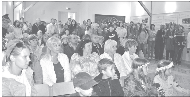
Pēc ilgāka laika kluba zālītē atkal bija ļaužu pilna.