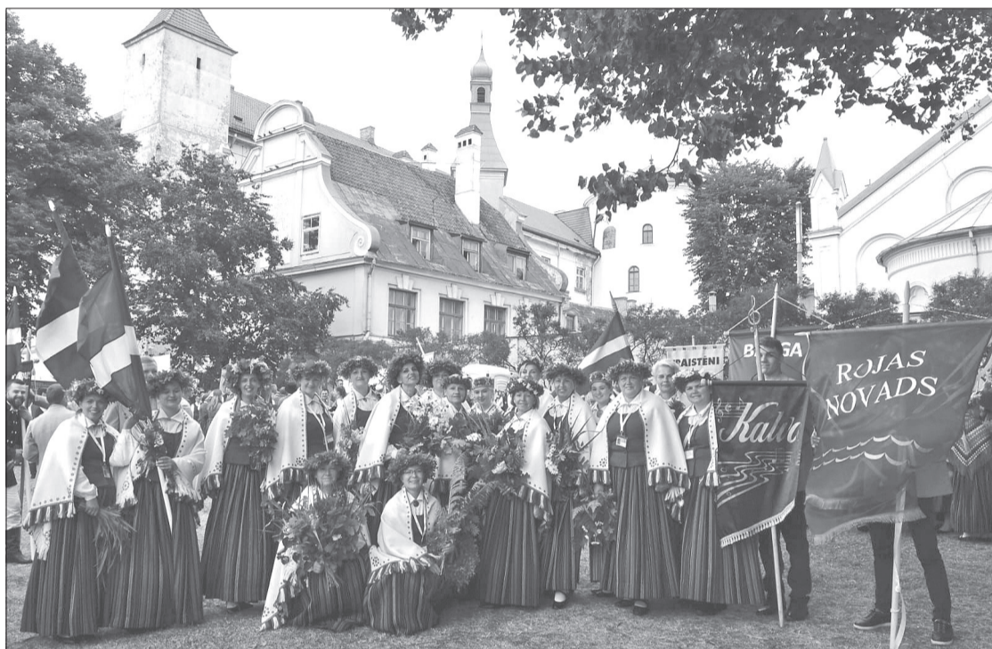
Sieviešu kora „Kalva” moto bija – „Kalva” Rīgu dimdināja”.

Rakstu rakstiem izdancota, greznām dziesmām piedziedāta šogad ir mūsu miļā Latvija. Ir Latvijas simtgade, ir Dziesmu un Deju svētku gads, un katrs sevi cenošs pašdarbības kolektīvs ieliek savas mīlestības artavu kopējā Latvijas jubilejas svētku vainagā.