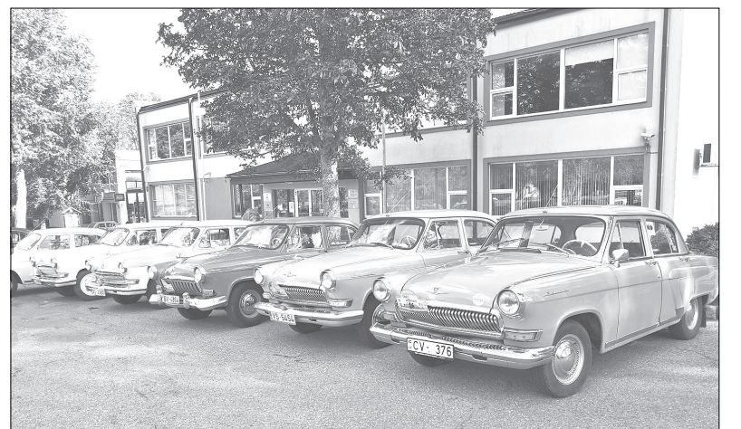
Rojā bija ieradušās ap 40 automašīnām. Ar vienu no viņām, sarkano Volgu, esot braucis pats Raimonds Pauls.