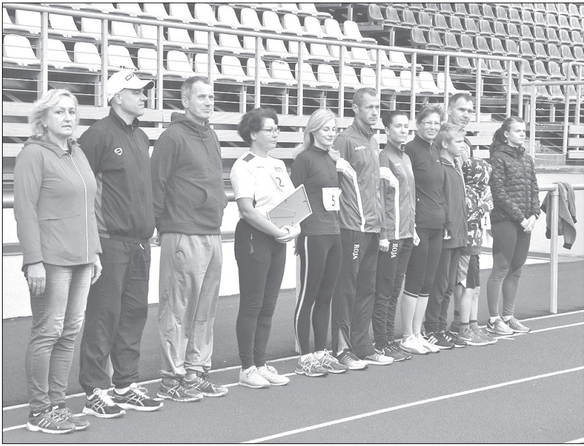
Pirmie dalībnieki stafetes skrējienam gatavi.