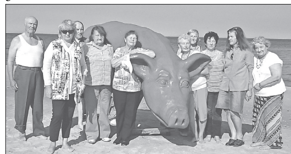
Viesi priecājās gan par mūsu sakopto pludmali, gan tās simbolu – zilo cerību sivēnu.