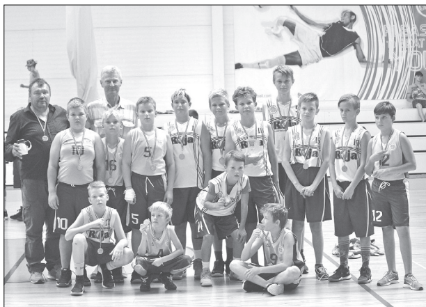
Pēc spraigām cīņām mūsu zēni saņēma kausu par 3. vietu turnīrā. Albuma foto